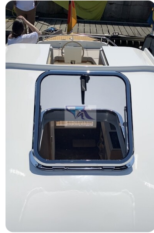
Tuck 22 20