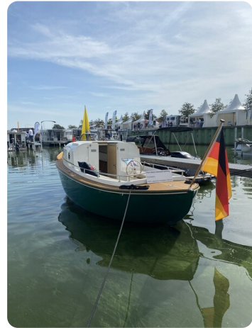
Tuck 22 21