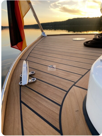
Tuck 22 6