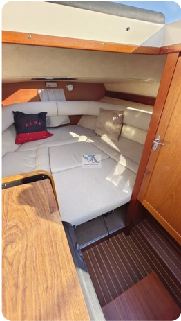
Windy 25 MIRAGE msp790159 24