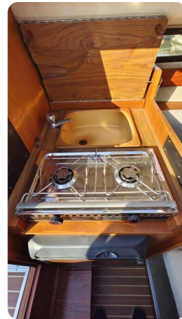
Windy 25 MIRAGE msp790159 28