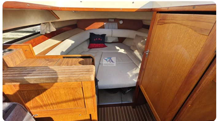
Windy 25 MIRAGE msp790159 21