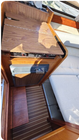
Windy 25 MIRAGE msp790159 27