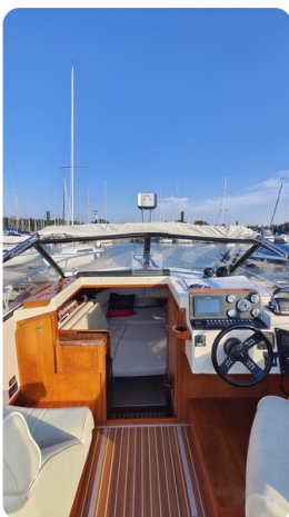
Windy 25 MIRAGE msp790159 45