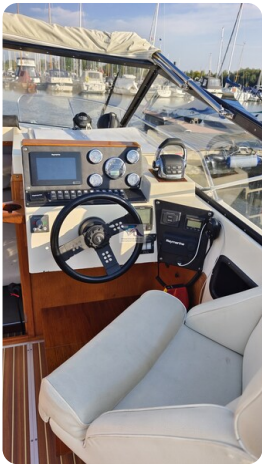
Windy 25 MIRAGE msp790159 35