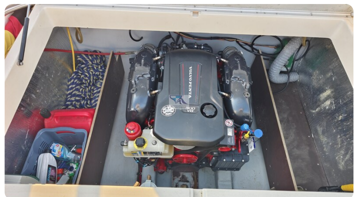
Windy 25 MIRAGE msp790159 51