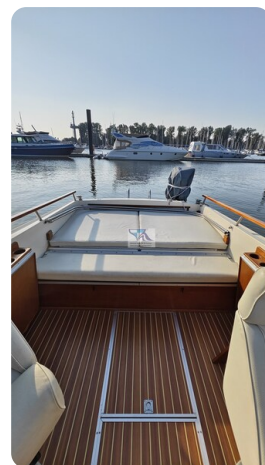
Windy 25 MIRAGE msp790159 42