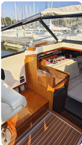
Windy 25 MIRAGE msp790159 38