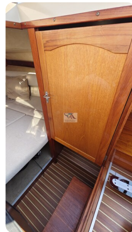
Windy 25 MIRAGE msp790159 26