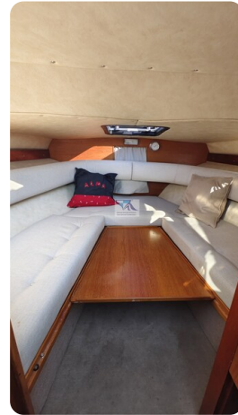
Windy 25 MIRAGE msp790159 33