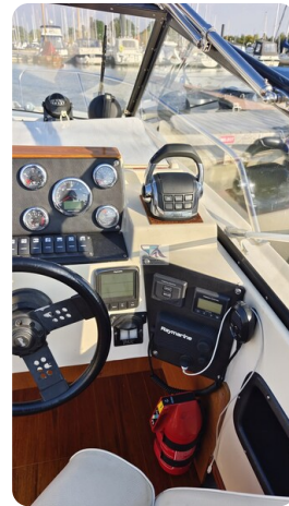
Windy 25 MIRAGE msp790159 37