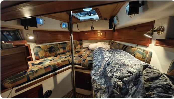
Westerly 36 Conway ANTIMALOCHE 37