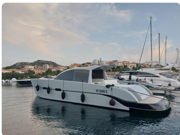
Vismara Bwave profile1