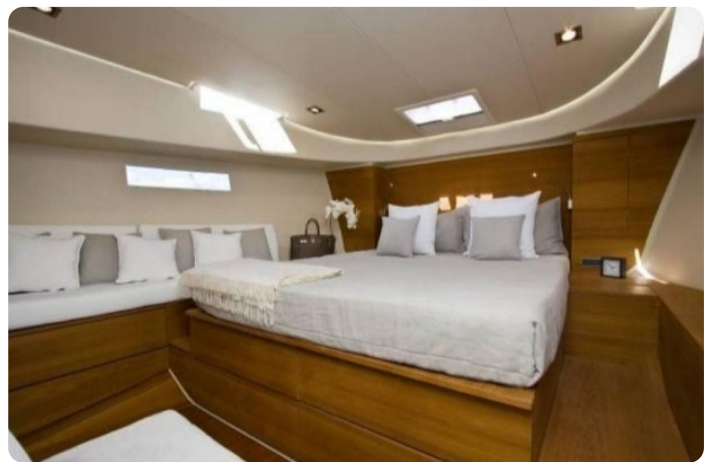
Vismara B Wave master cabin