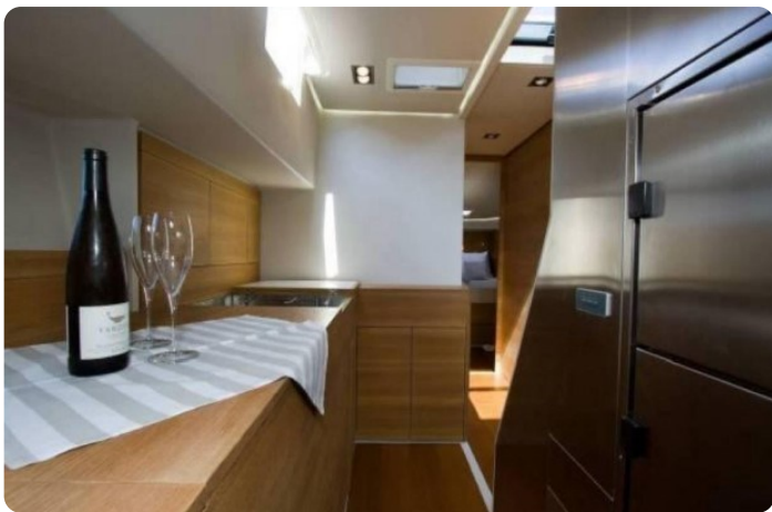
Vismara B Wave galley