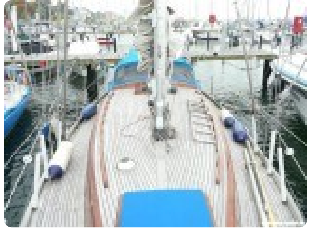
Vindö 50 msp269542 2