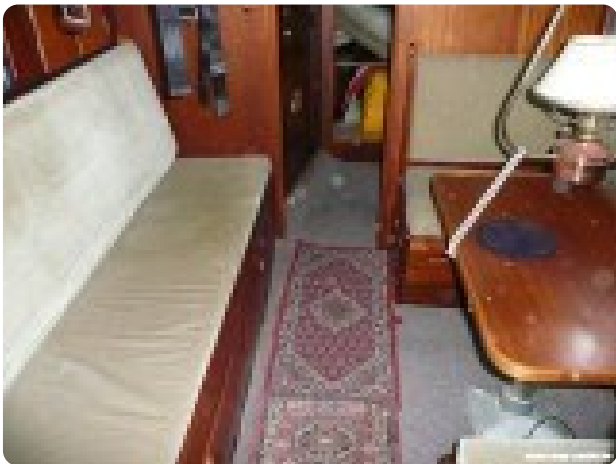
Vindö 50 msp269542 8