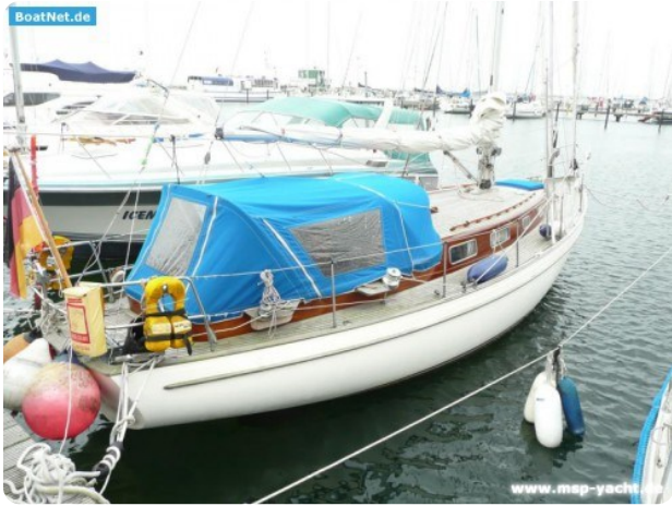
Vindö 50 msp269542 1