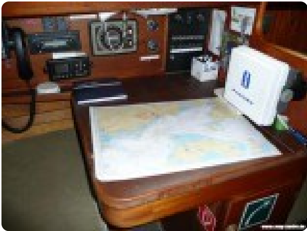
Vindö 50 msp269542 6