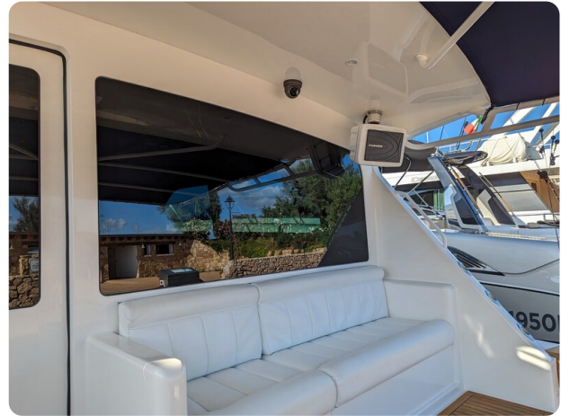
Viking 54 Convertible cockpit lounge