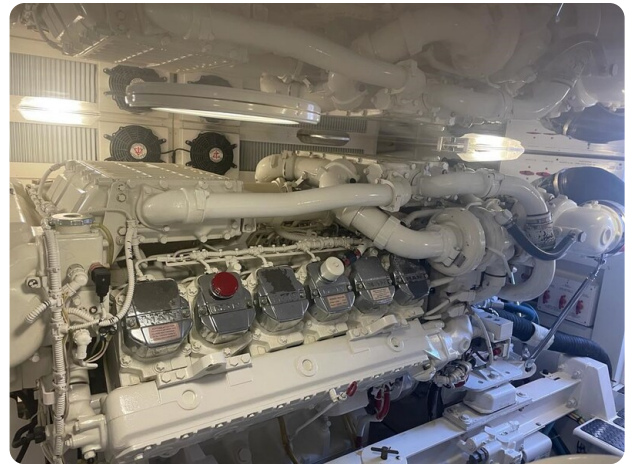
Viking 54 Convertible engine detail