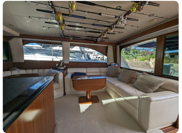
Viking 54 Convertible salon detail