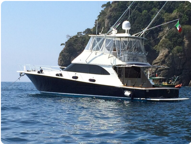
Viking 54 Anchored