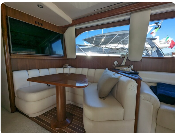
Viking 54 Convertible dinette detail