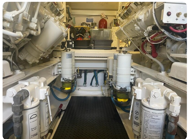
Viking 54 Convertible engine room