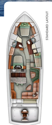
Viking 54 layout