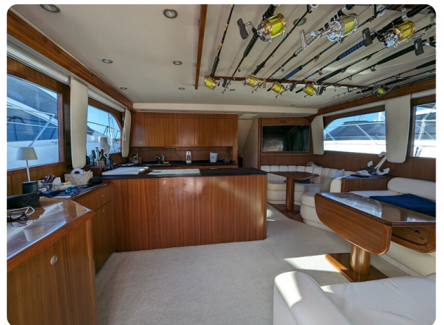
Viking 54 Convertible salon