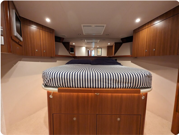
Viking 54 Convertible Vip cabin