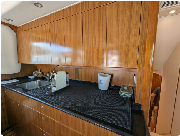
Viking 54 Convertible galley detail