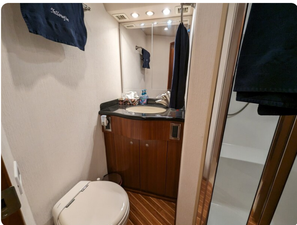
Viking 54 Convertible guest bathroom