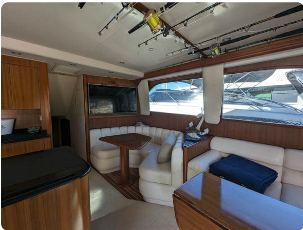
Viking 54 Convertible salon dinette