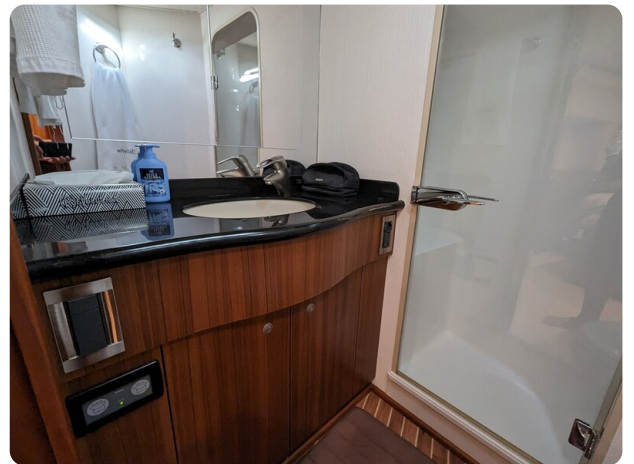
Viking 54 Convertible bathroom