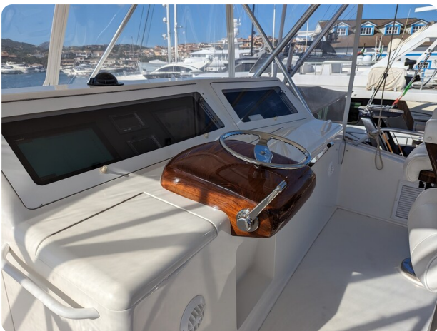
Viking 54 Convertible helm station