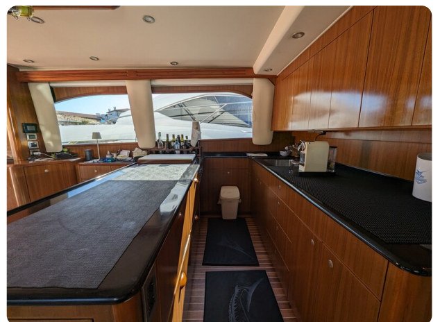
Viking 54 Convertible galley