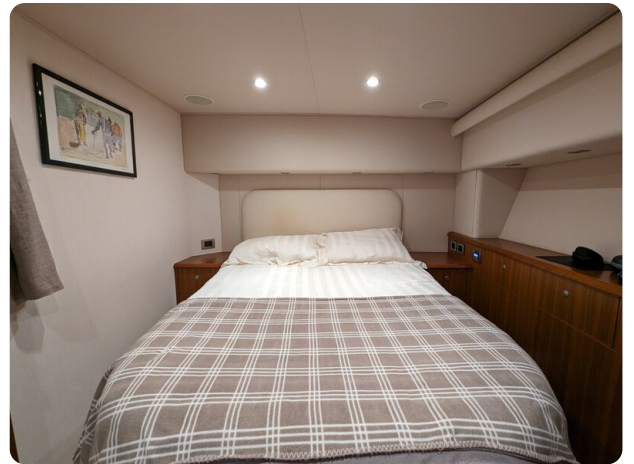
Viking 54 Convertible master cabin