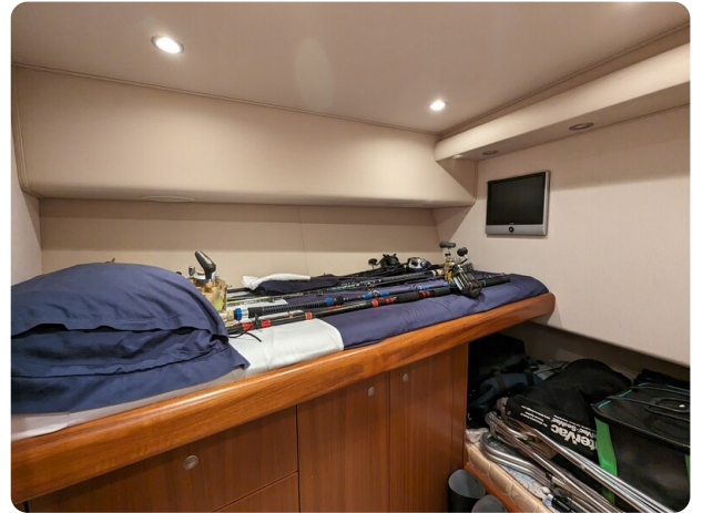
Viking 54 Convertible guest cabin