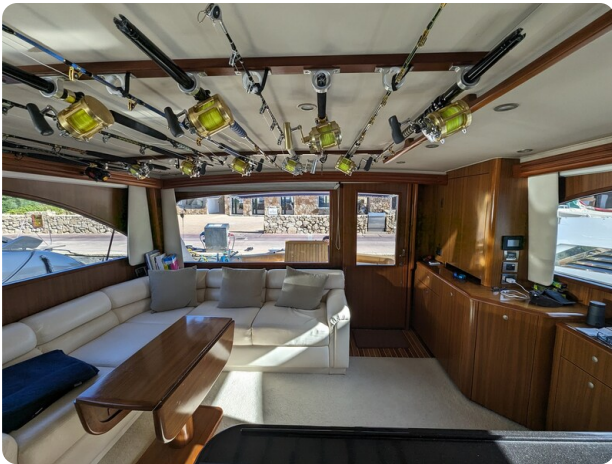
Viking 54 Convertible salon to aft