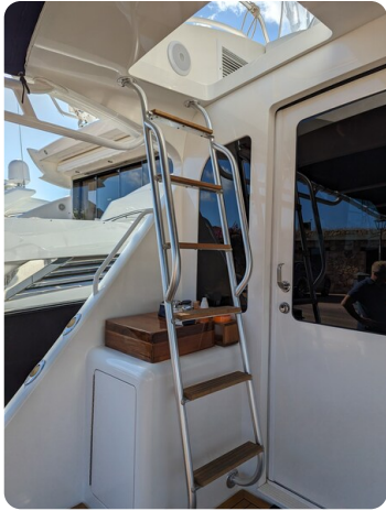
Viking 54 Convertible Fly stair