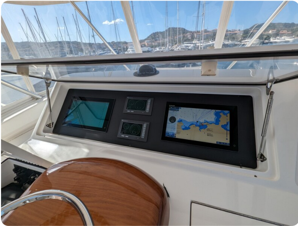
Viking 54 Convertible electronics