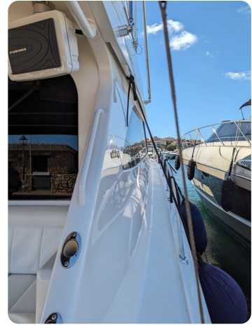
Viking 54 Convertible sideways