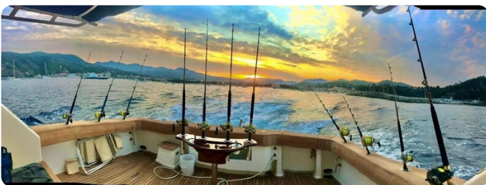
Viking 54 fishing