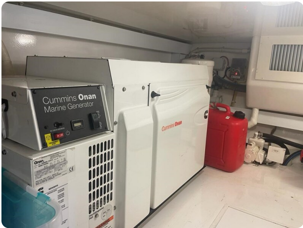
Viking 54 Convertible generator