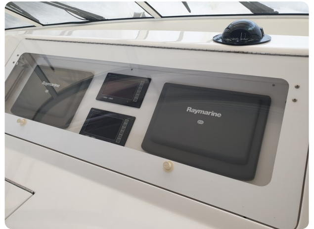
Viking 45 Open, electronics