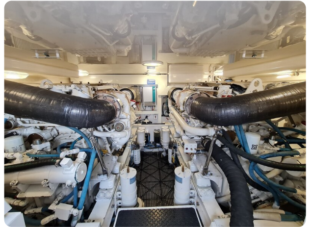
Viking 45 Open, engine room