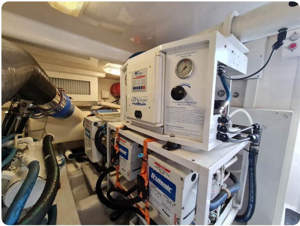
Viking 45 Open, engine room detail