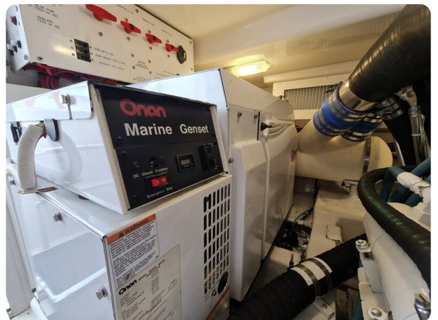
Viking 45 Open, generator