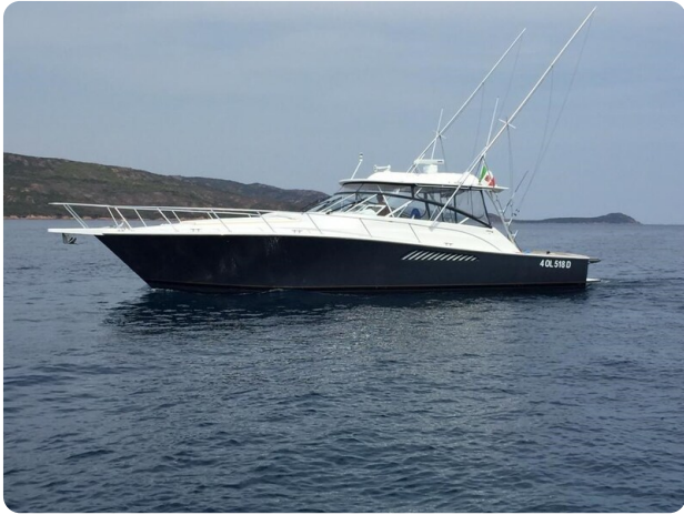
Viking 45 Open, profile