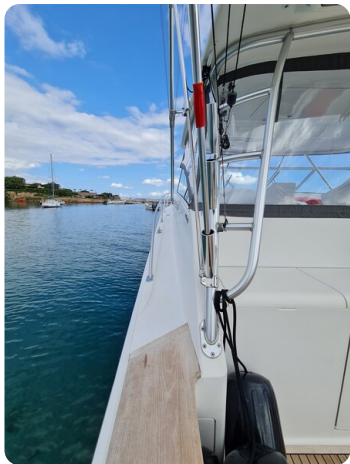
Viking 45 Open, detail