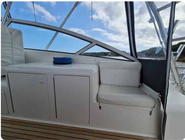
Viking 45 Open, cockpit bar