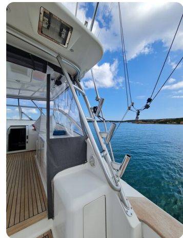
Viking 45 Open, cockpit details