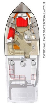
Viking 45' Open layout