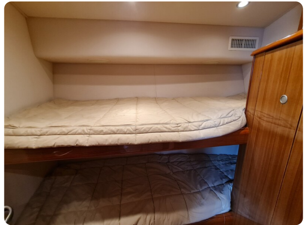
Viking 45 Open, guest cabin