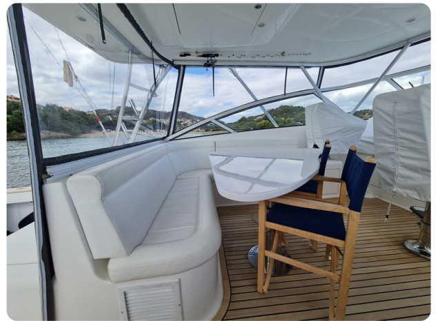
Viking 45 Open, cockpit dinette