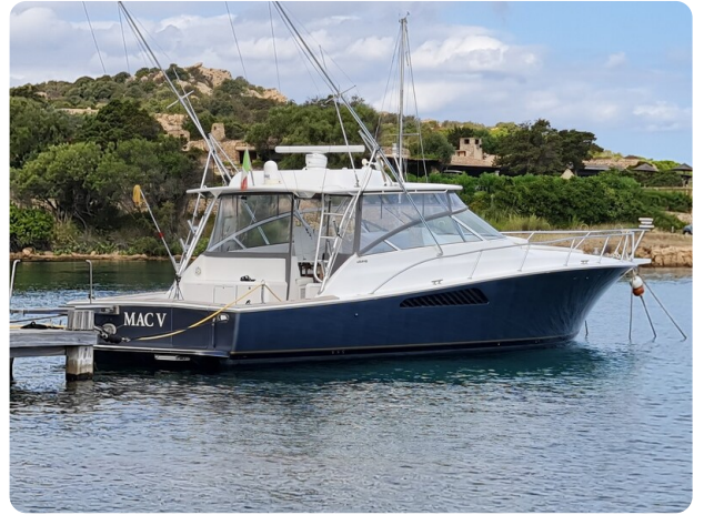
Viking 45 Open, aft profile