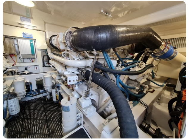
Viking 45 Open stbd engine