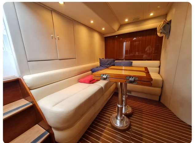
Viking 45 Open, dinette