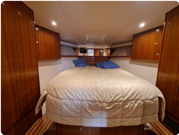
Viking 45 Open, master cabin