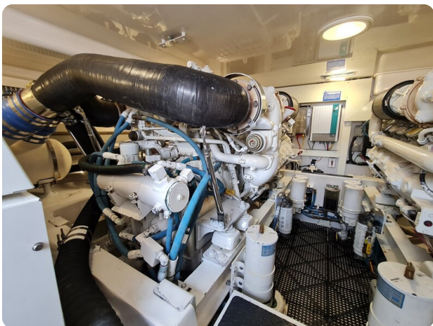
Viking 45 Open, port engine detail