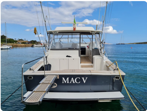
Viking 45 Open, stern view