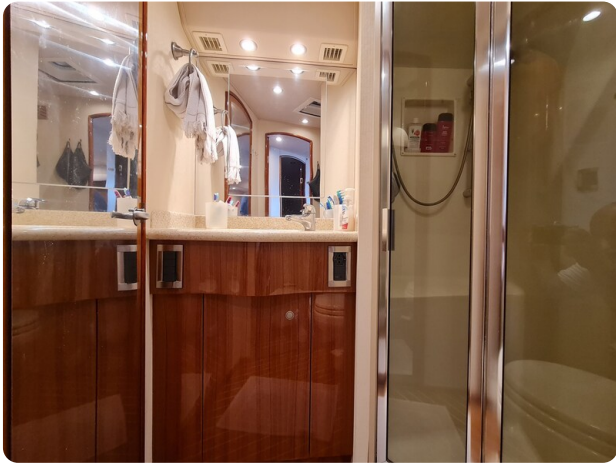
Viking 45 Open, bathroom