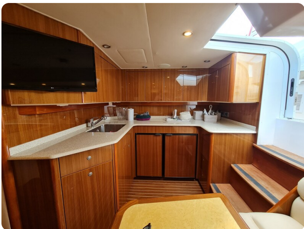
Viking 45 Open, galley