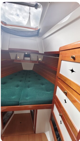
Helena 35 4