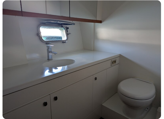
Toy Tender 47 owner's bathroom