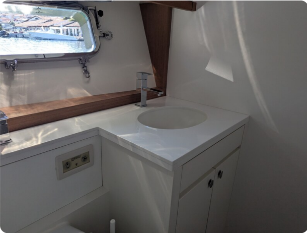
Toy Tender 47 guest bathroom