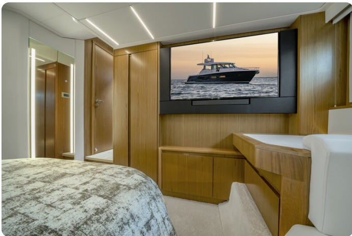
Tiara EX60 cabin detail