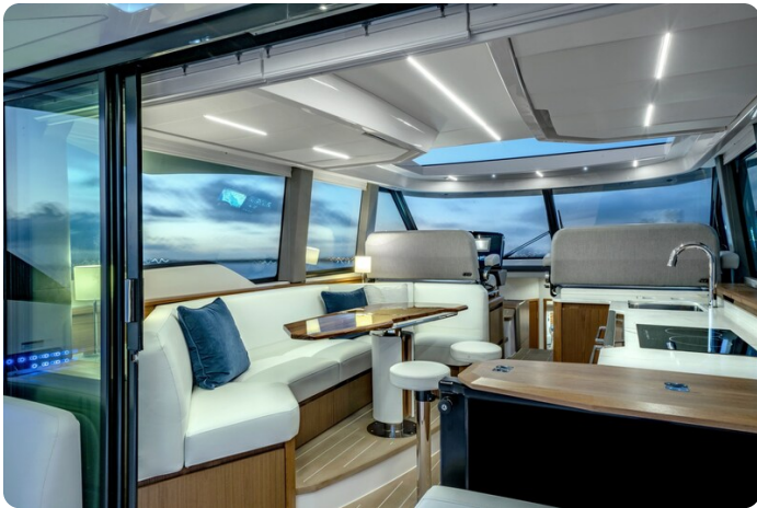
Tiara EX60 salon view