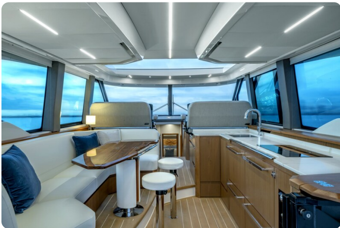
Tiara EX60 salon