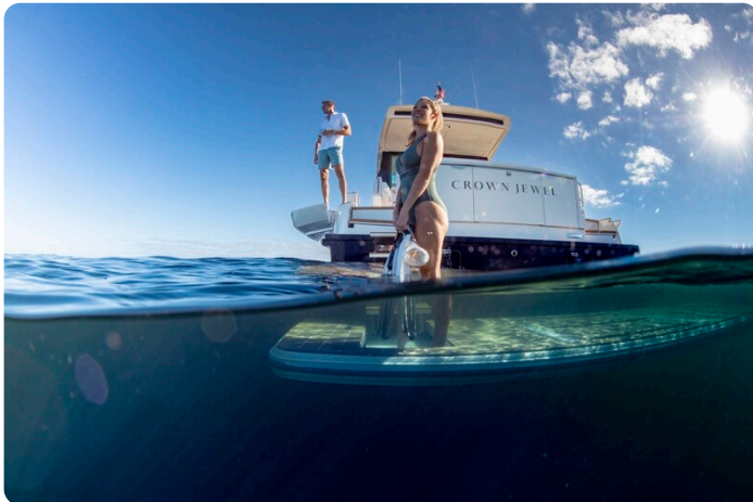
Tiara EX60 lifestyle