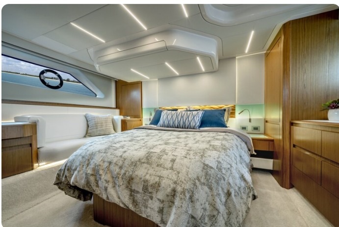
Tiara EX60 owner's cabin