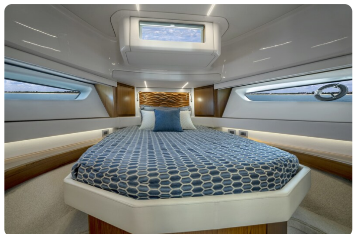
Tiara EX60 Vip cabin