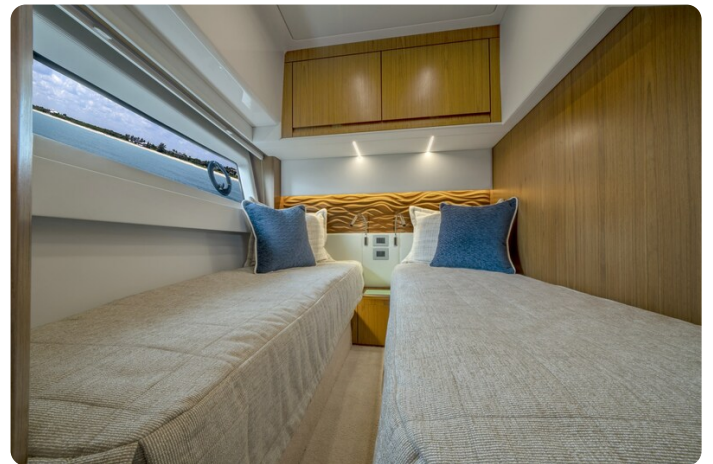
Tiara EX60 guest cabin