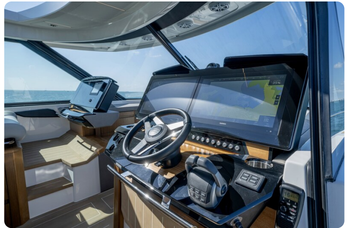
Tiara EX60 helm