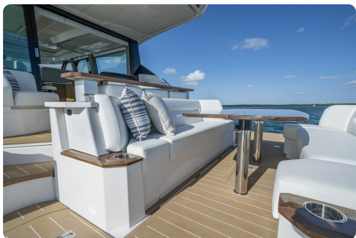
Tiara EX60 cockpit dinette