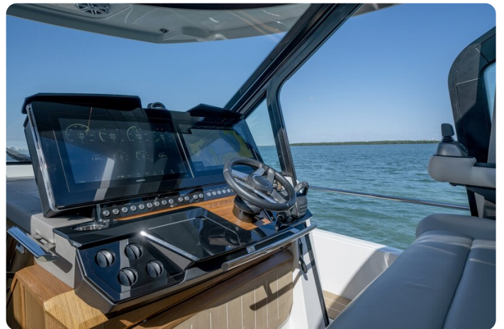
Tiara EX60 helm station