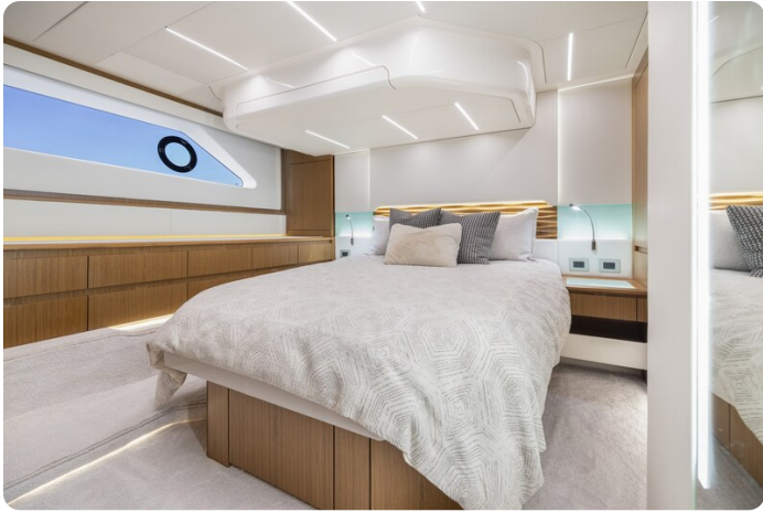
Tiara EX54 owner's cabin