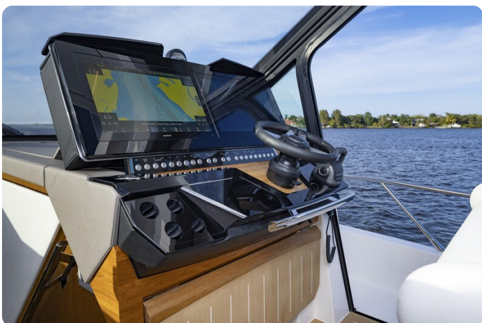
Tiara EX54 helm station