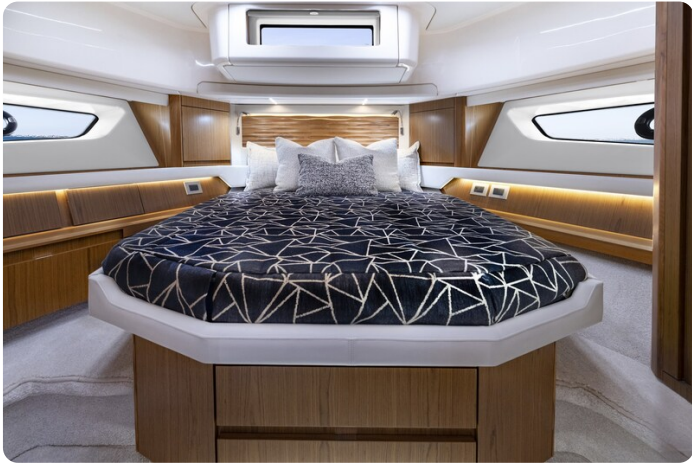
Tiara EX54 Vip cabin