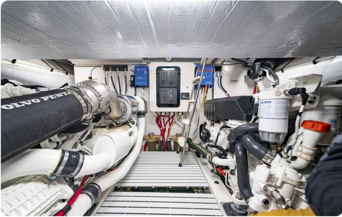
Tiara EX54 engine room