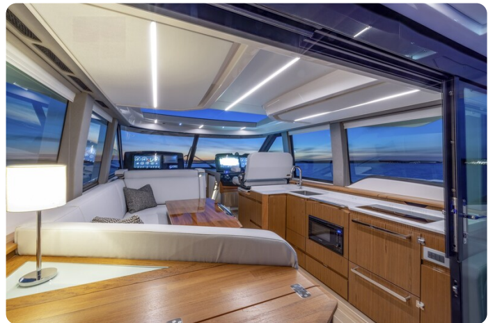
Tiara EX54 galley