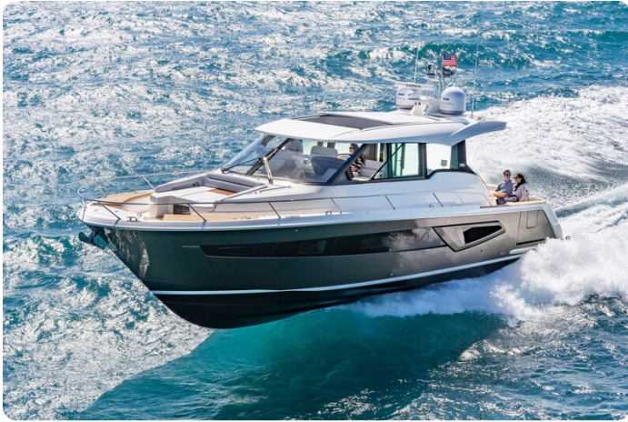
Tiara EX54 running