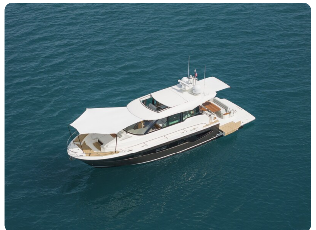
Tiara EX54 anchored