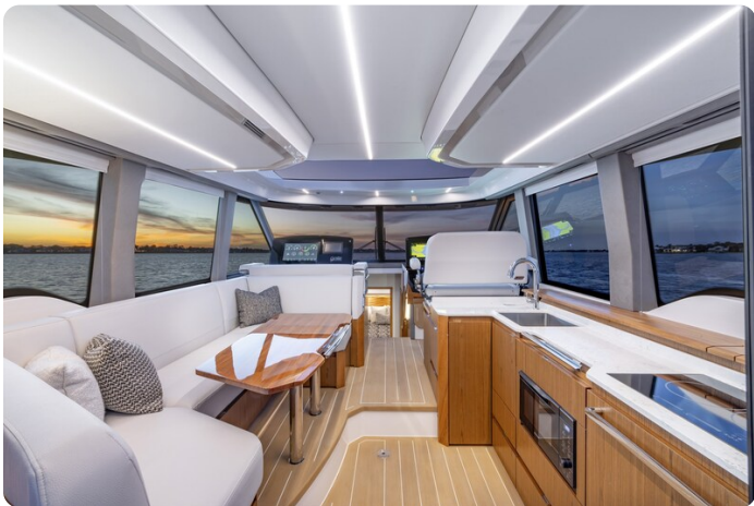
Tiara EX54 salon