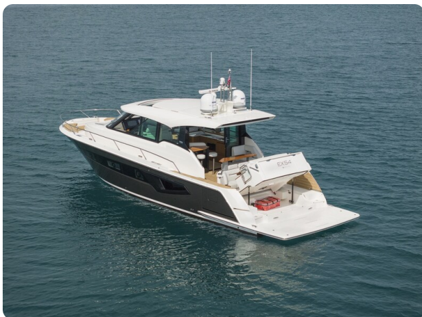
Tiara EX54 aft view