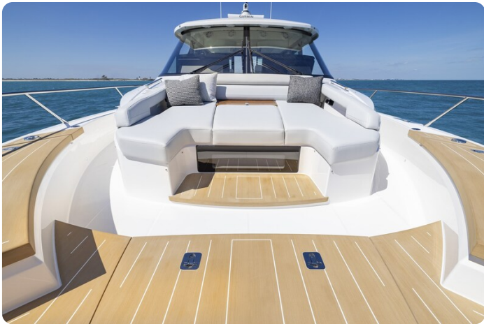
Tiara EX54 bow deck