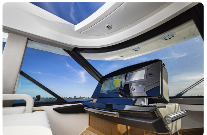
Tiara EX54 Companion Helm