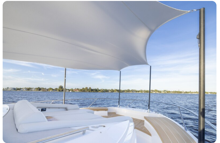
Tiara EX54 bow sunshade