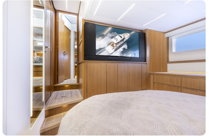
Tiara EX54 owner's cabin detail