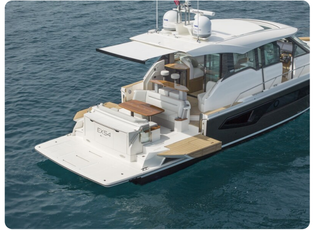
Tiara EX54 cockpit view