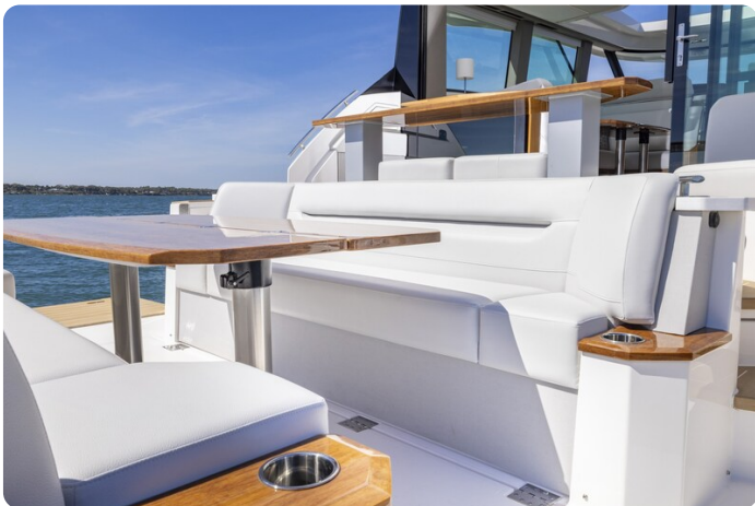
Tiara EX54 Aft Cockpit Lounge