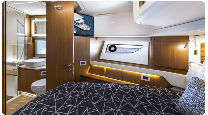
Tiara EX54 Vip cabin detail