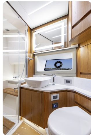
Tiara EX54 bathroom