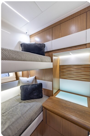
Tiara EX54 guest cabin