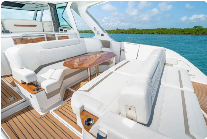
Tiara 48LS aft dinette