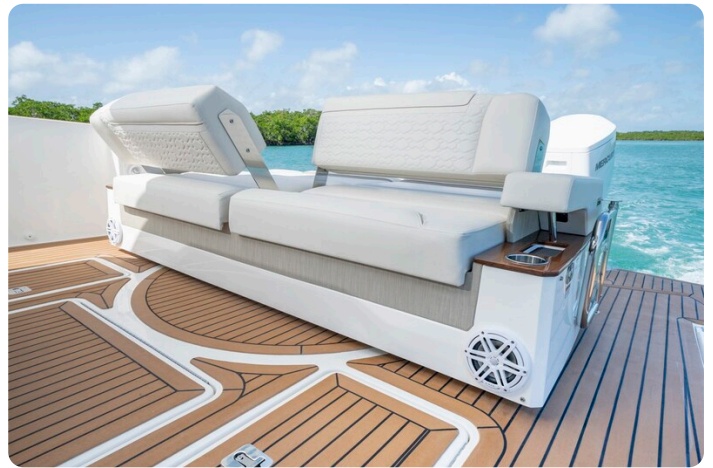
Tiara 48LS aft seats