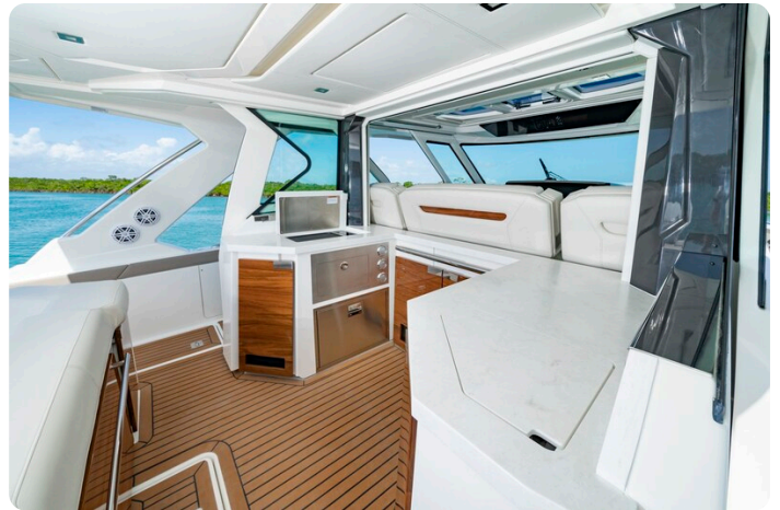
Tiara 48LS cockpit galley