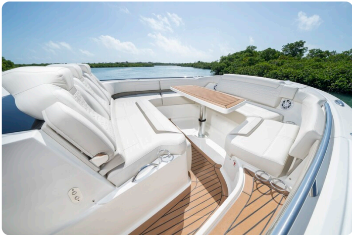
Tiara 48LS fwd dinette detail