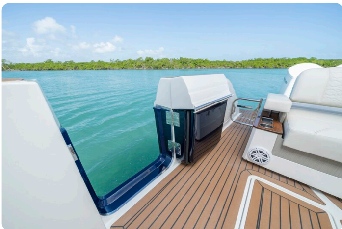
Tiara 48LS side door