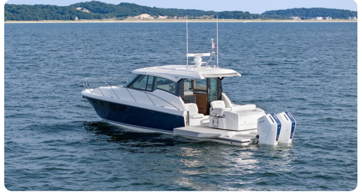
43 LE Nav