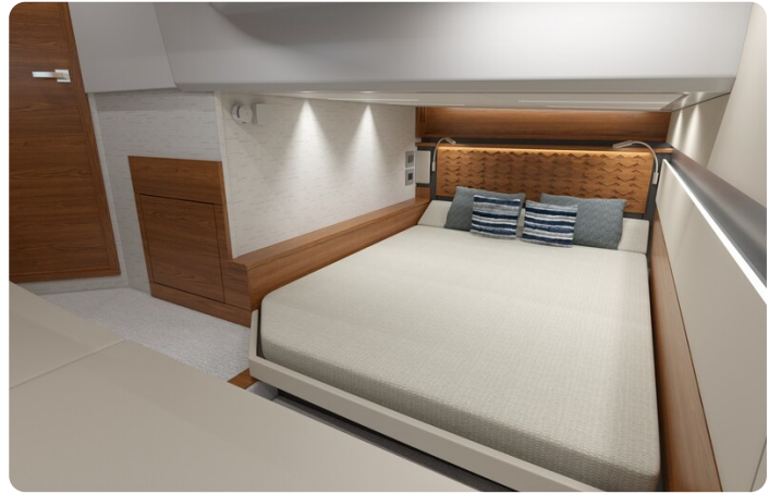
Tiara 43LE aft cabin