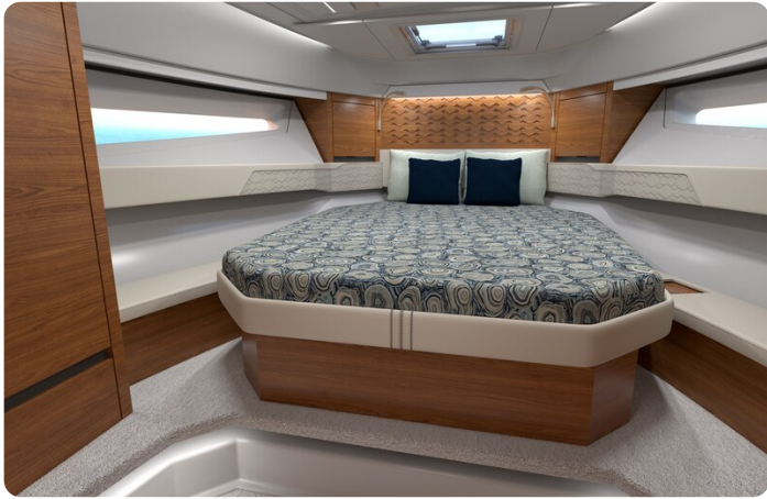
Tiara 43LE owner's cabin