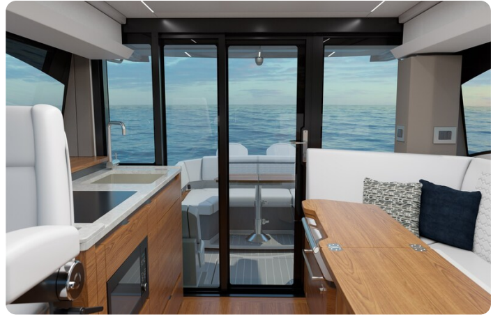
43le-rendering-interior-Salon with Doors Closed