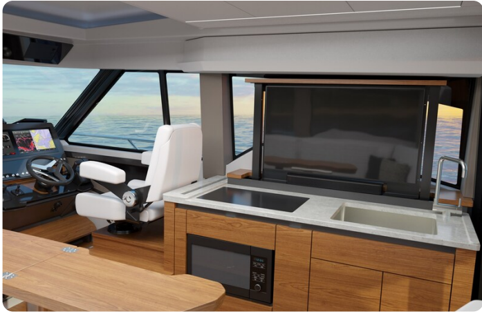
Tiara 43LE galley with TV up