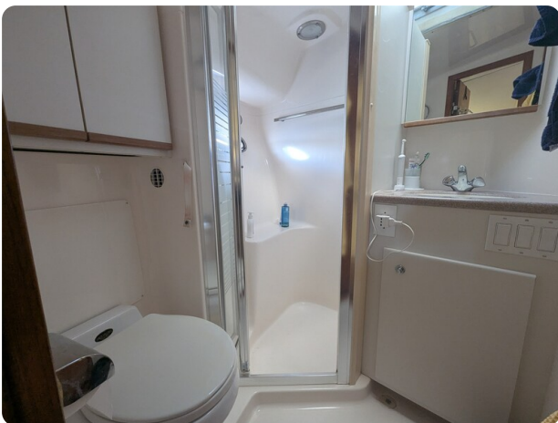
Tiara 4100 Open head view