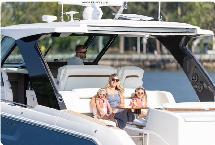
Tiara 39LS lifestyle