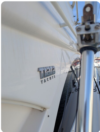
Tiara 3900 Conv. details