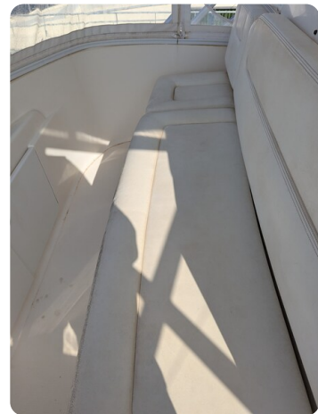
Tiara 3900 Conv. Fly dinette