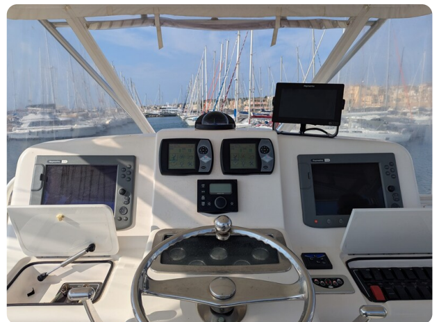
Tiara 3900 Conv. Helm station