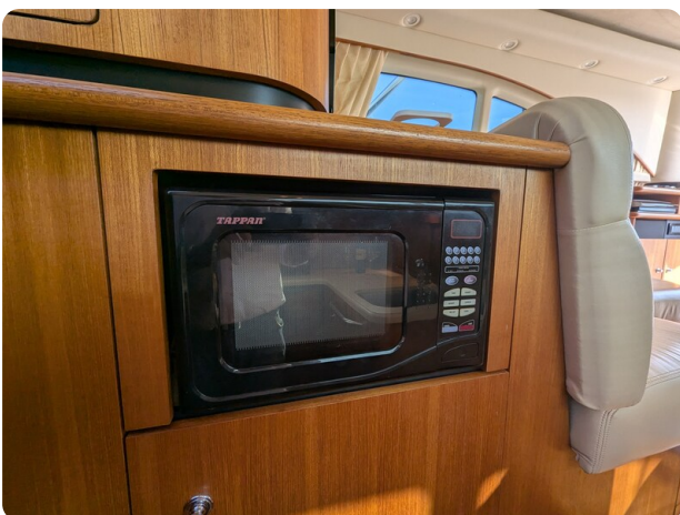
Tiara 3900 Conv. Galley detail