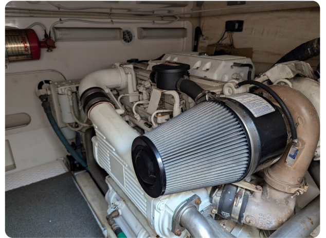
Tiara 3900 Conv. engine detail