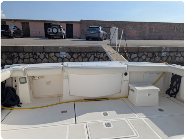
Tiara 3900 Conv. cockpit