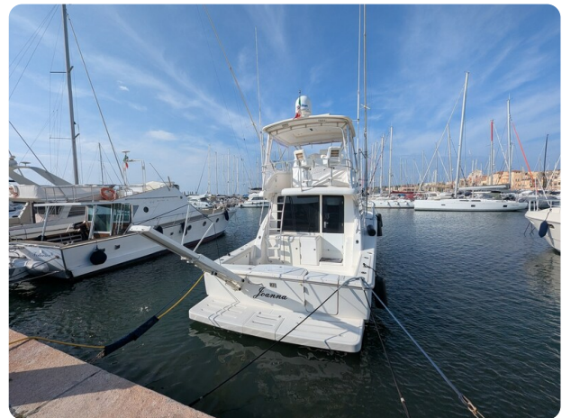
Tiara 3900 Conv. stern view