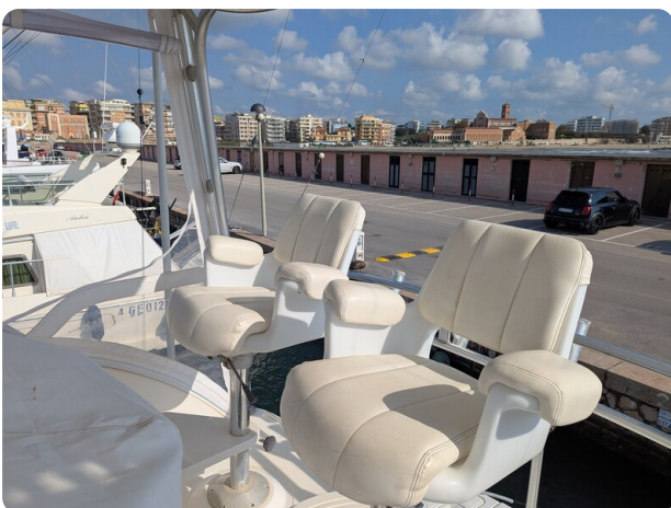
Tiara 3900 Conv. Fly seats