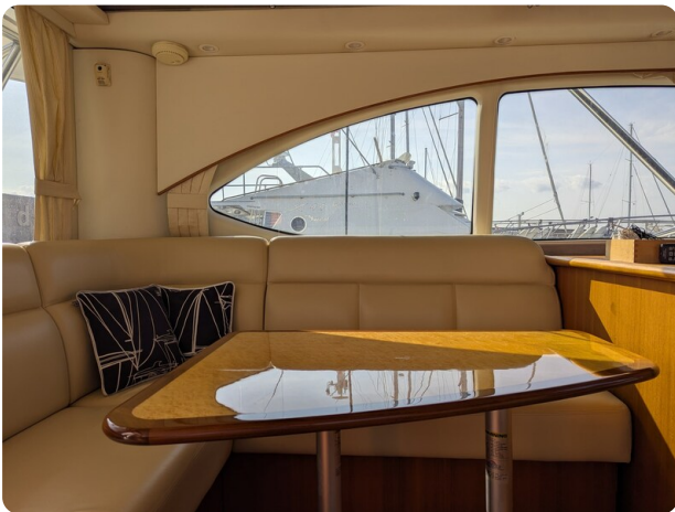
Tiara 3900 Conv. dinette