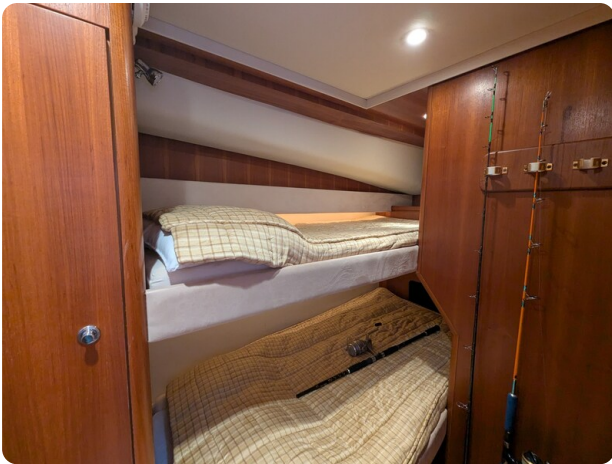
Tiara 3900 Conv. guest cabin