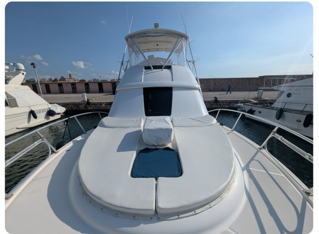
Tiara 3900 Conv. bow deck