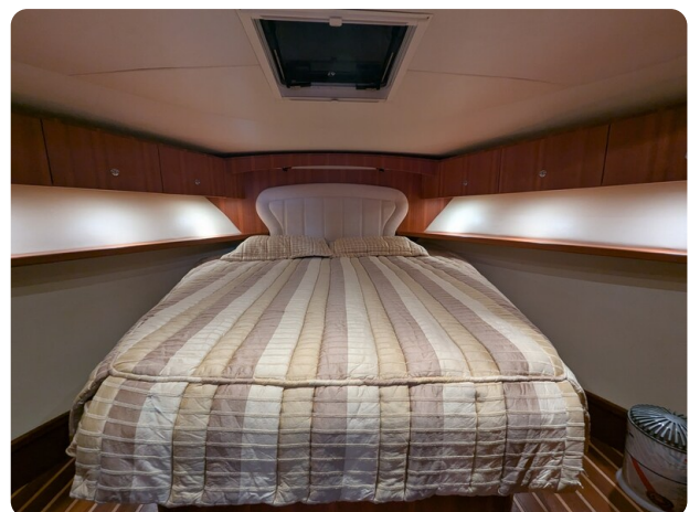
Tiara 3900 Conv. master cabin