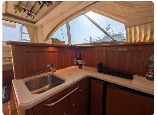
Tiara 3900 Conv. galley