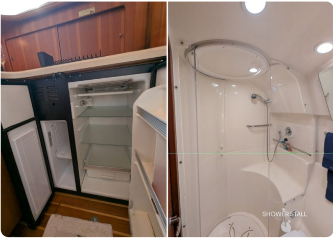
{1} Galley fridge