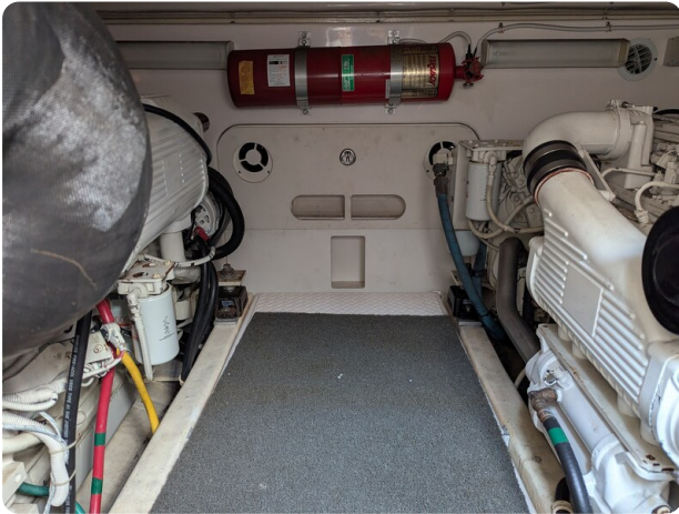
Tiara 3900 Conv. engine room