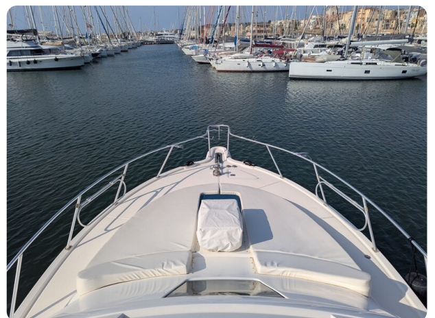
Tiara 3900 Conv. bow sunpad