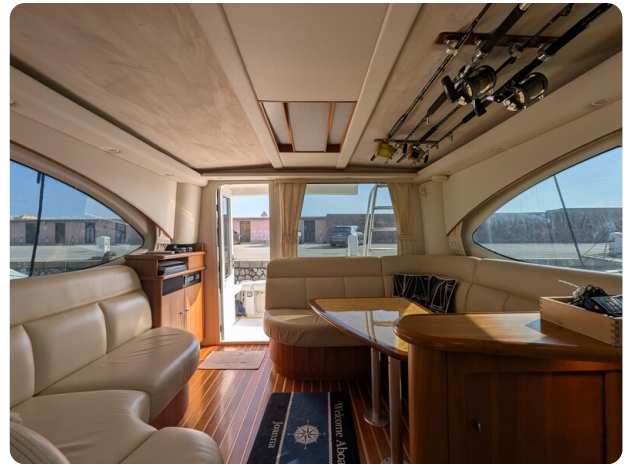
Tiara 3900 Conv. salon to aft