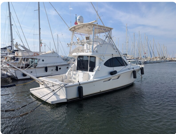
Tiara 3900 Conv. profile