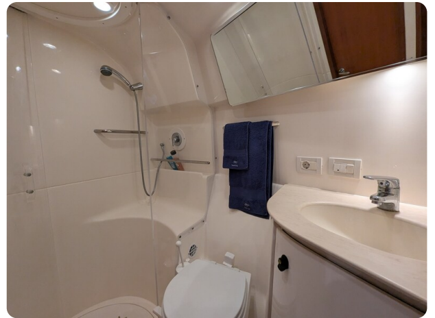
Tiara 3900 Conv. bathroom