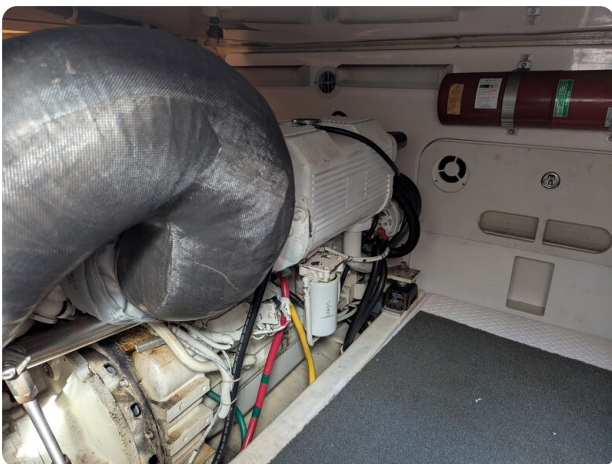
Tiara 3900 Conv. engine details