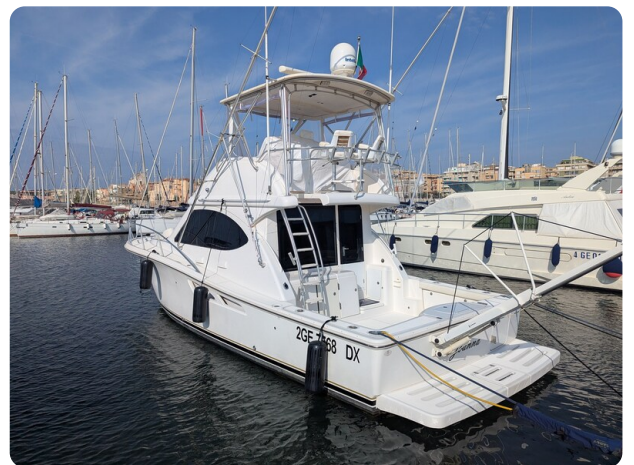
Tiara 3900 Conv. aft profile