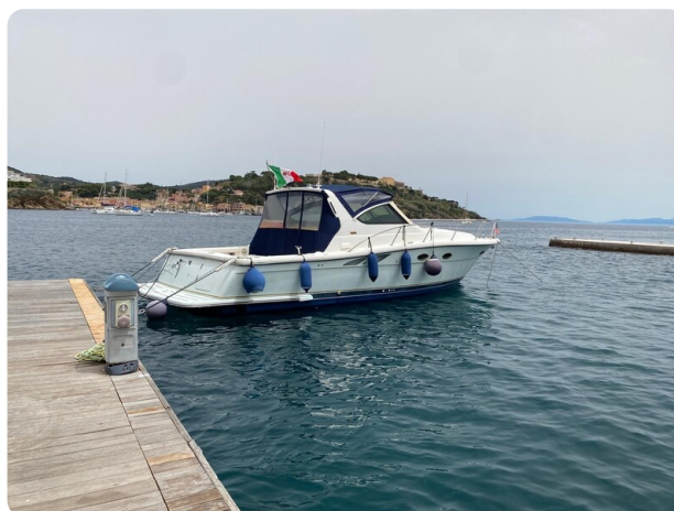
Tiara 3800 Open exterior