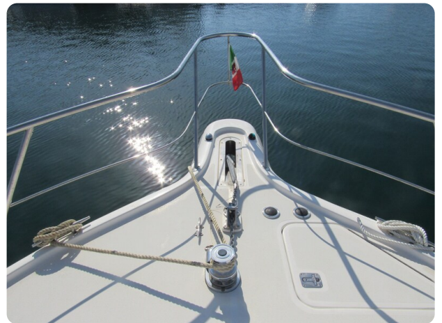
Tiara 3800 Open, bow pulpit