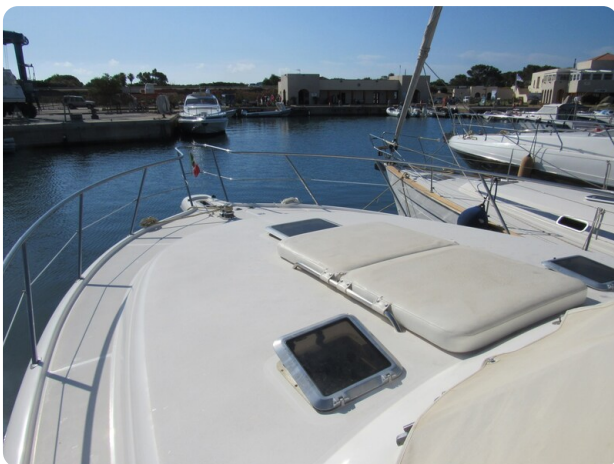
Tiara 3800 Open,