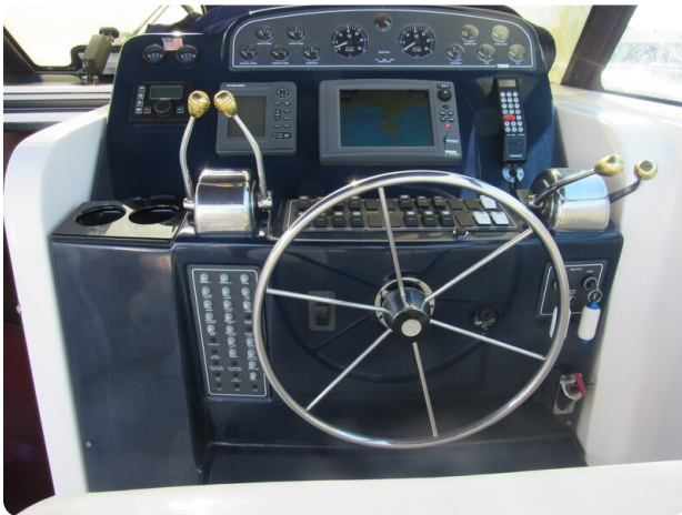
Tiara 3800 Open, helm