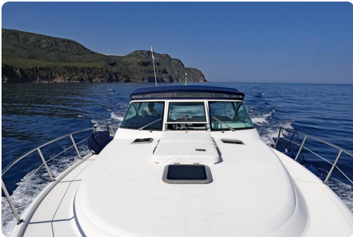
Tiara 3800 Open Effetto Cupido 1