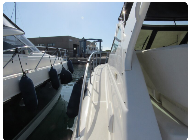
Tiara 3800 Open, sideways