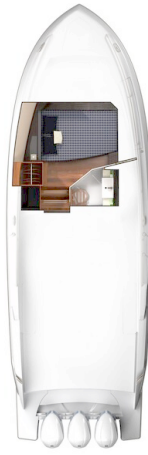
Tiara 38 LS lower layout