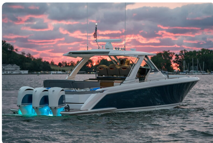
Tiara 38 LS aft profile