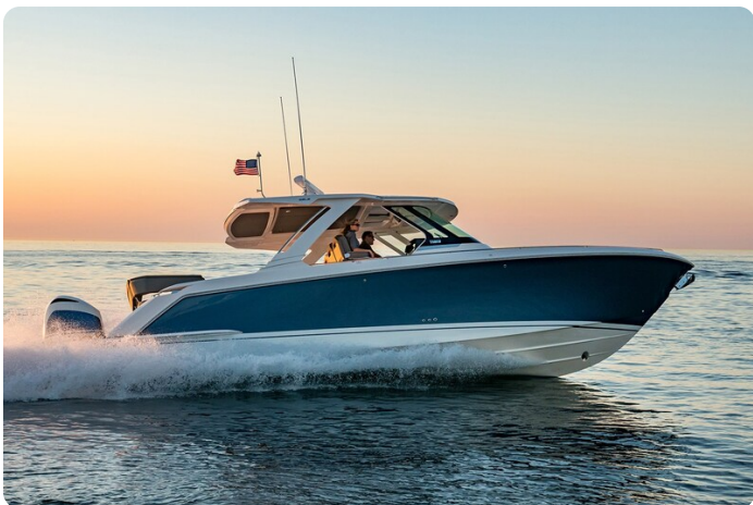
Tiara 38 LS running