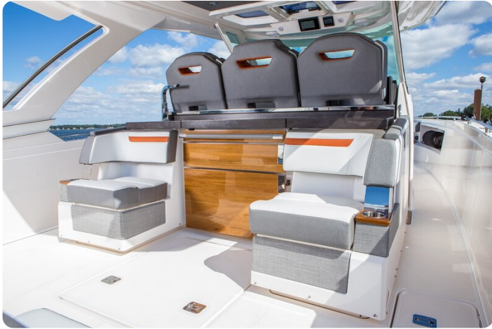
Tiara 38 LS cockpit galley