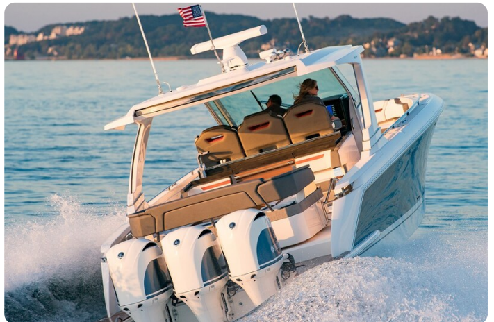
Tiara 38 LS sft running