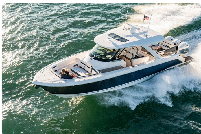
Tiara 38 LS bow profile aerial