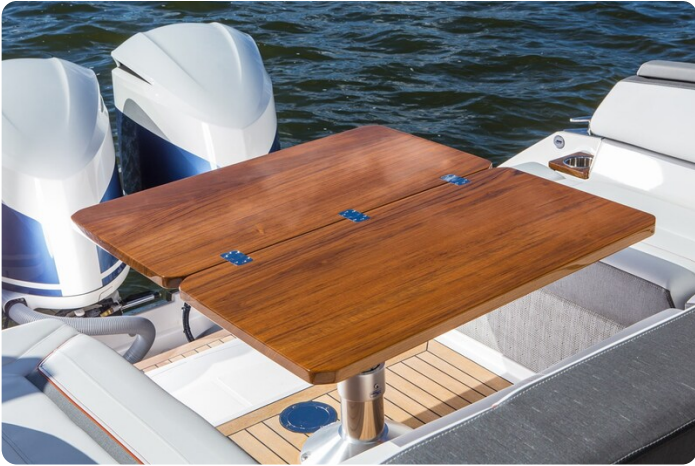
Tiara 38 LS aft table