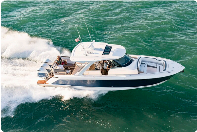
Tiara 38 LS aerial running