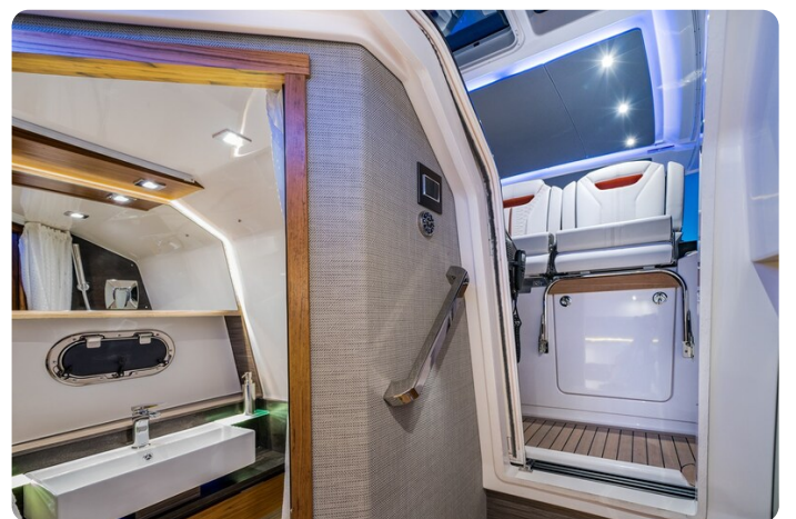
Tiara 38 LS head