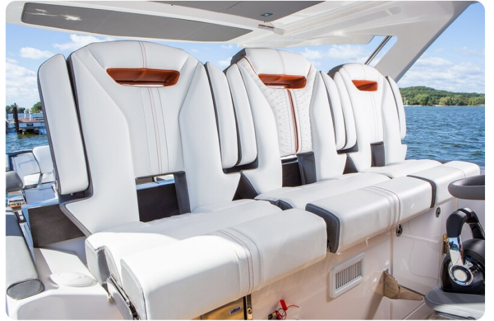
Tiara 38 LS pilot seats