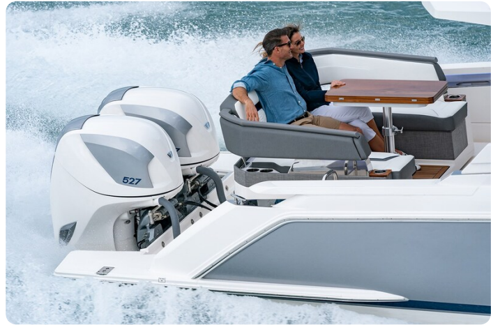
Tiara 38 LS rotating lounge