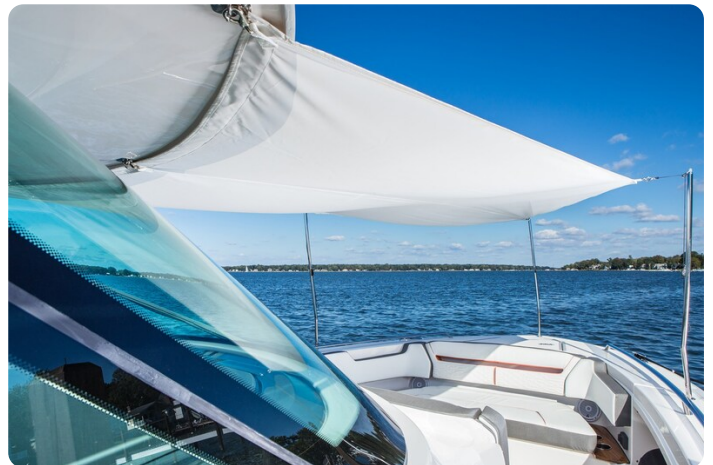
Tiara 38 LS fwd sunshade