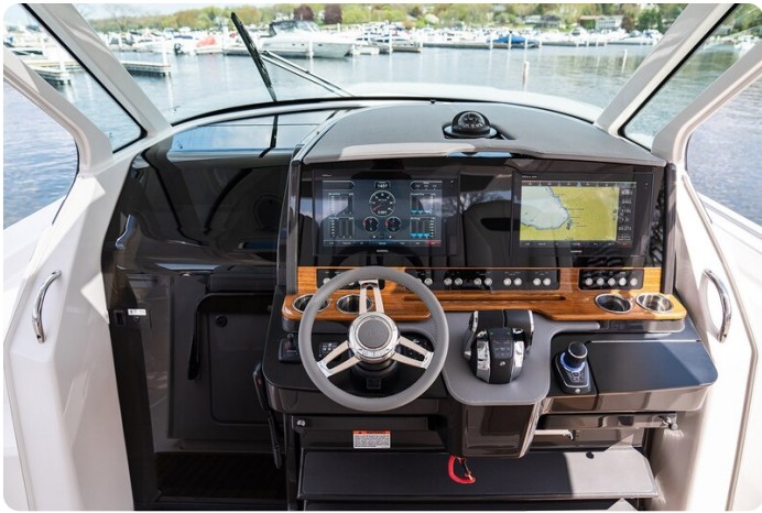
Tiara 38 LS helm station