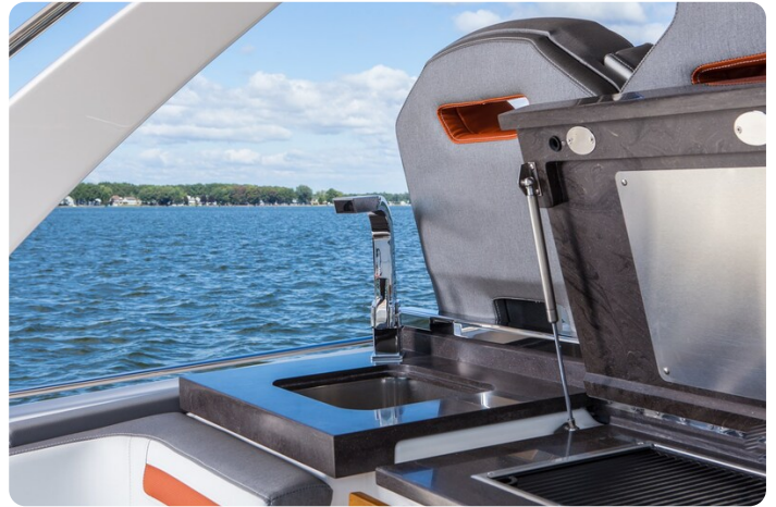
Tiara 38 LS countertop