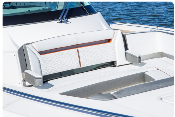
Tiara 38 LS fwd dinette