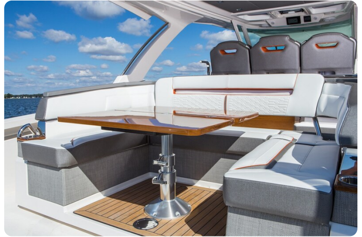
Tiara 38 LS cockpit dinette