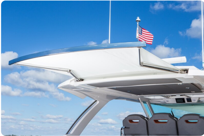
Tiara 38 LS cockpit sunshade