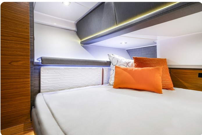
Tiara 38 LS full berth