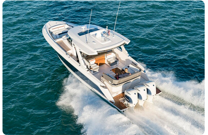
Tiara 38 LS aerial