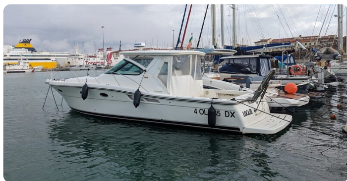
Tiara 3600 Open, profile