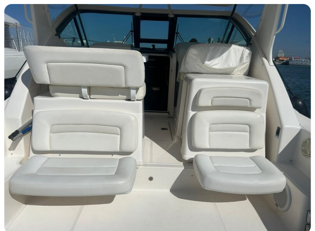
Tiara 3600 Open cockpit seats (2)