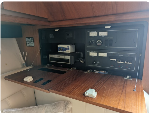
Tiara 3600 Open electrical panel