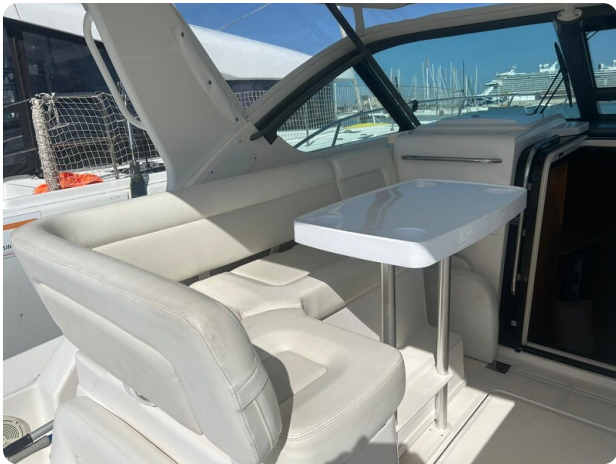
Tiara 3600 Open upper cockpit dinette