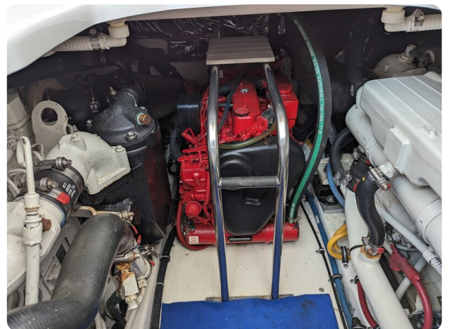
Tiara 3600 Open generator