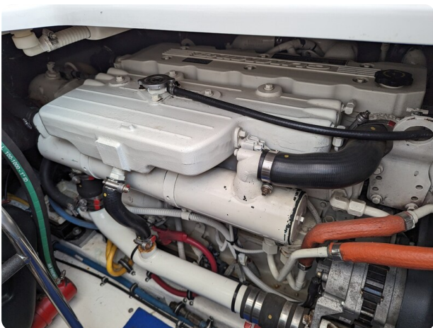
Tiara 3600 Open engine detail