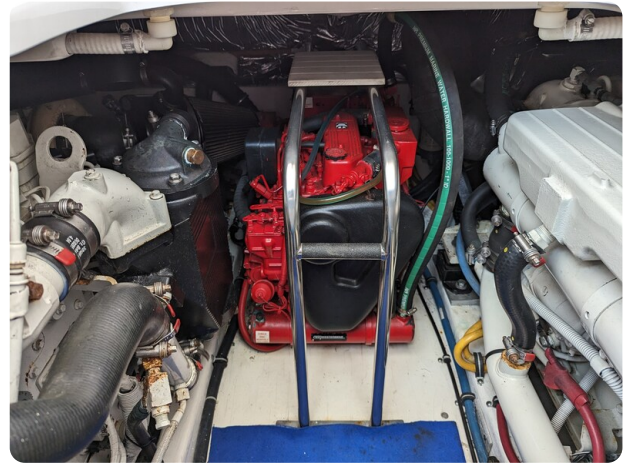
Tiara 3600 Open engine room