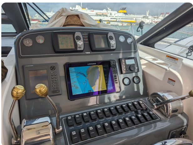
Tiara 3600 Open Helm