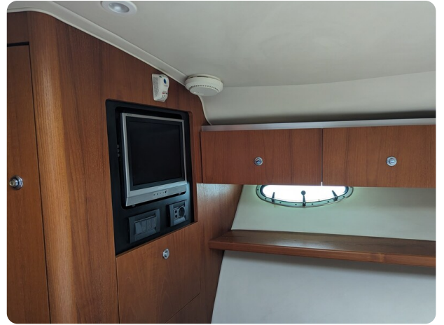
Tiara 3600 Open master cabin's TV