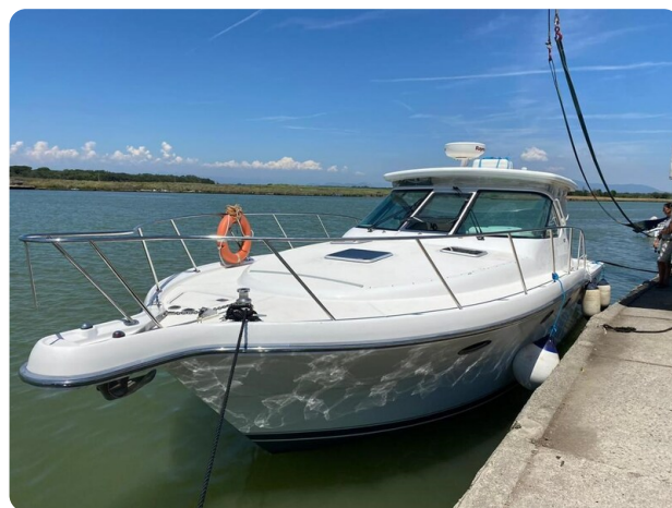
Tiara 3600 Open bow profile