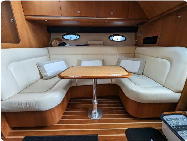
Tiara 3600 Open dinette