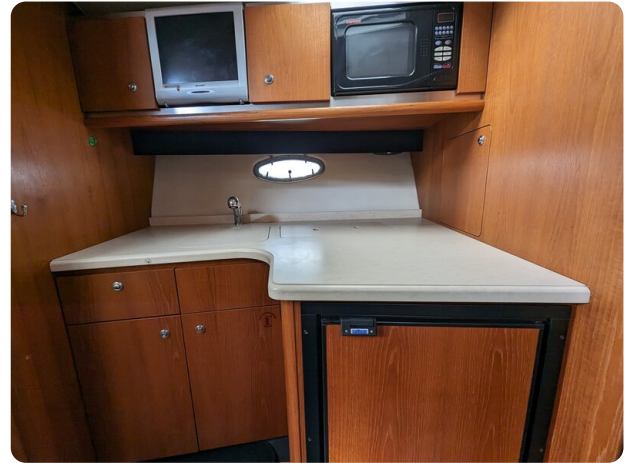
Tiara 3600 Open galley