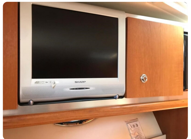
Tiara 3600 Open Tv