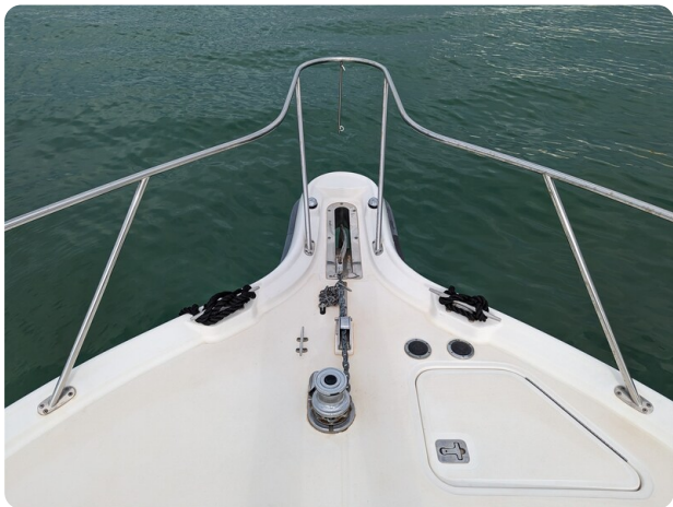
Tiara 3600 Open bow pulpit