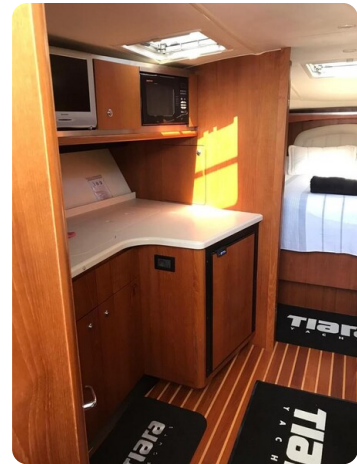
Tiara 3600 Open galley