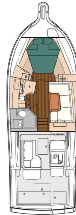
Tiara 3600 Open, layout