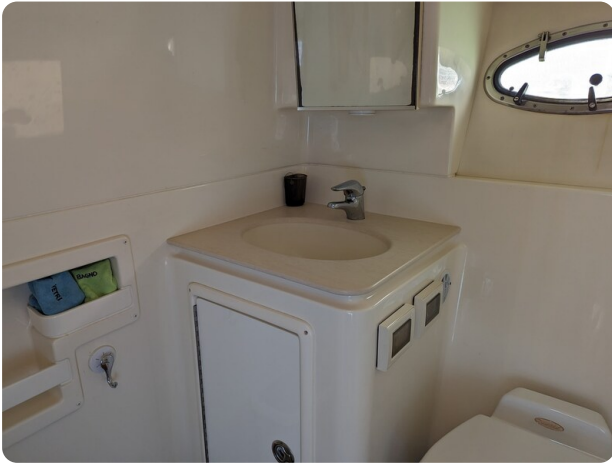
Tiara 3600 Open bathroom