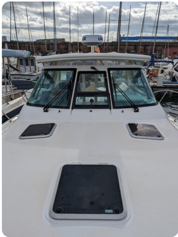
Tiara 3600 Open fwd deck