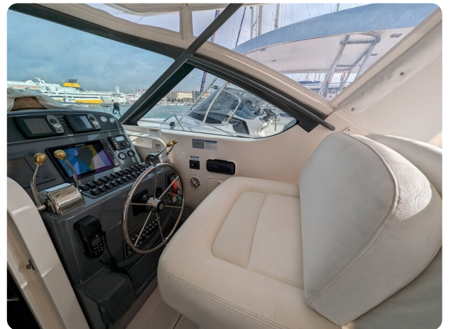
Tiara 3600 Open Helm station