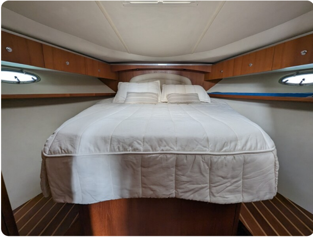
Tiara 3600 Open master cabin