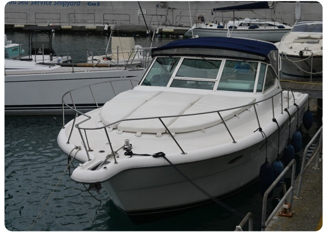
Tiara 3500 Open Sampei bow view