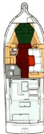
Tiara 3500 layout