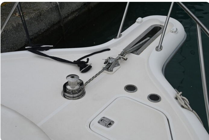
Tiara 3500 Open Sampei bow pulpit