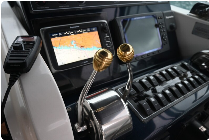
Tiara 3500 Open Sampei helm detail