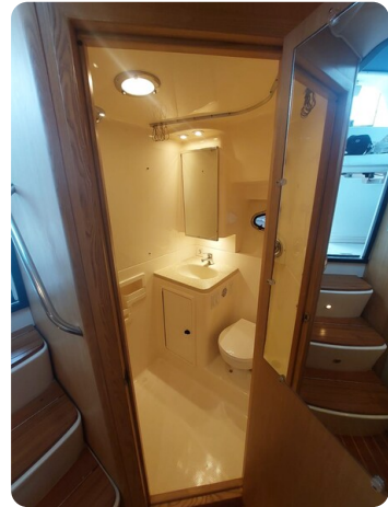
Tiara 3500 Open Sampei bathroom