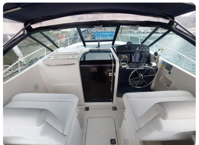
Tiara 3500 Open Sampei helm area