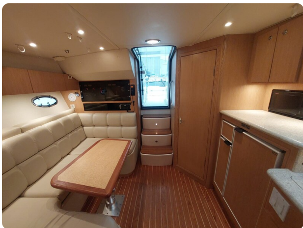
Tiara 3500 Open Sampei cabin view