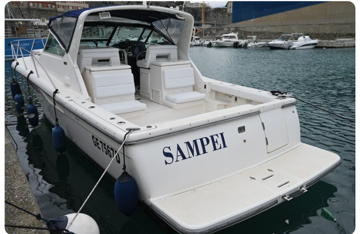
Tiara 3500 Open Sampei aft profile 2