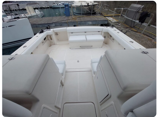
Tiara 3500 Open Sampei cockpit view