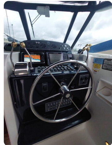
Tiara 3500 Open Sampei helm station