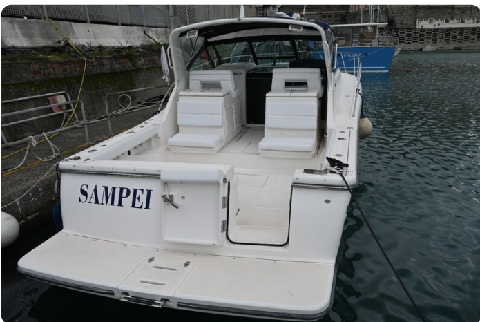
Tiara 3500 Open Sampei stern view