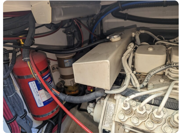
Tiara 3500 Open engine detail