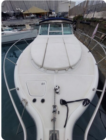
Tiara 3500 Open Sampei fwd deck