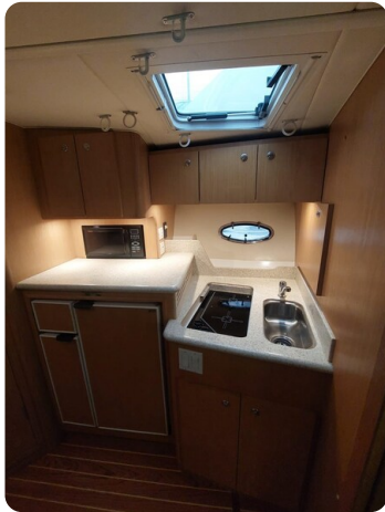
Tiara 3500 Open Sampei galley