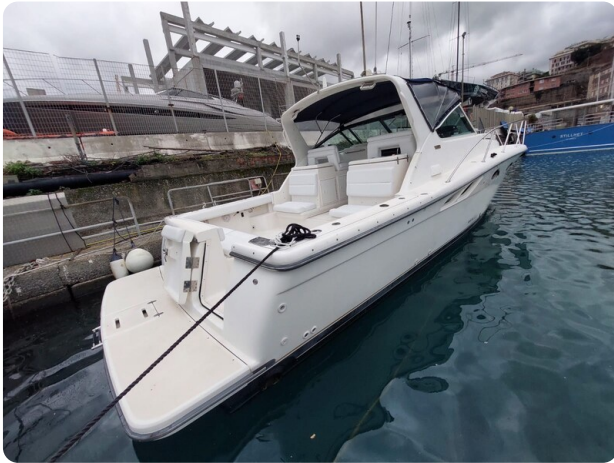
Tiara 3500 Open Sampei aft profile