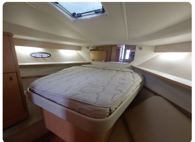
Tiara 3500 Open Sampei cabin