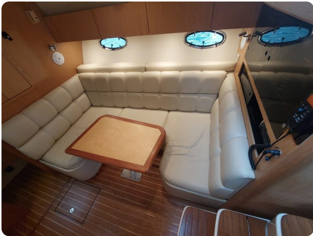
Tiara 3500 Open Sampei dinette