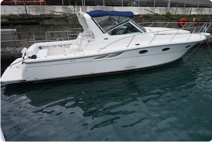
Tiara 3500 Open Sampei profile