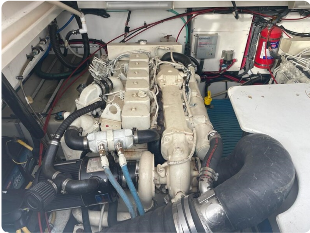
Tiara 3500 Open engine detail.jpg