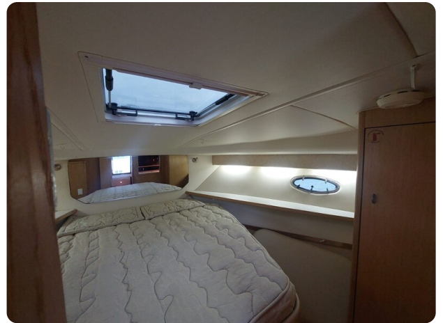
Tiara 3500 Open Sampei cabin detail