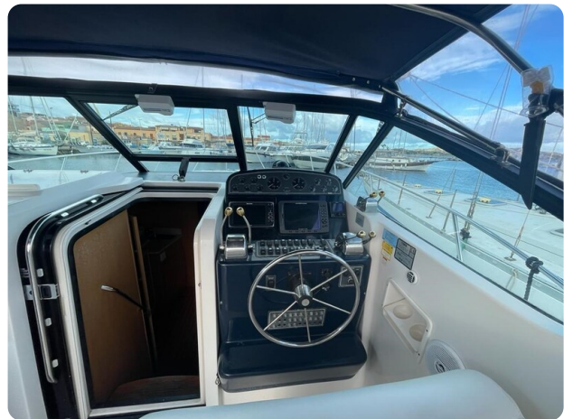
Tiara 3500 Open helm station.jpg