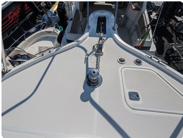
Tiara 3500 Open, bow pulpit