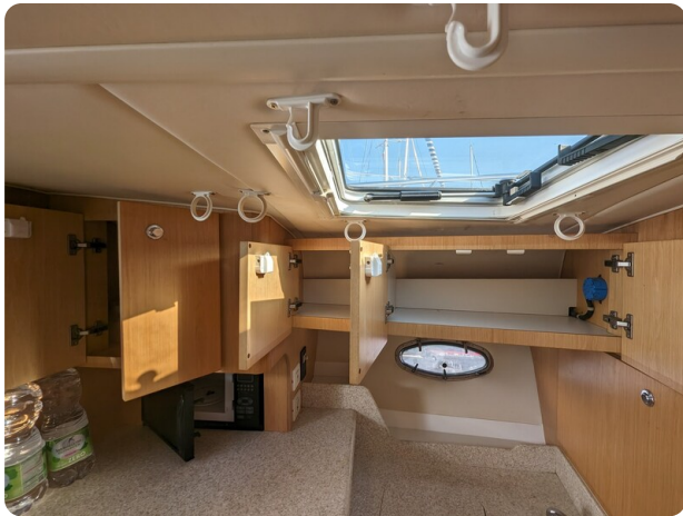
Tiara 3500 Open galley detail