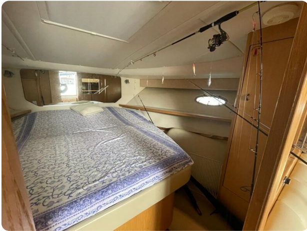
Tiara 3500 Open cabin.jpg