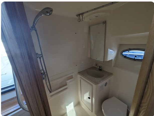
Tiara 3500 Open head