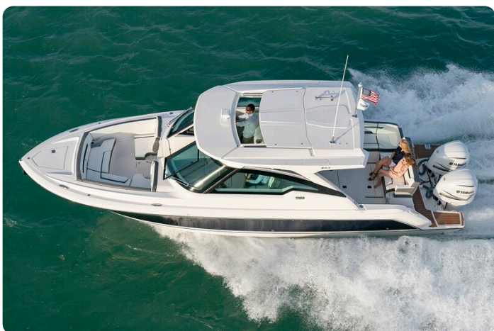
Tiara 34 LX aerial view