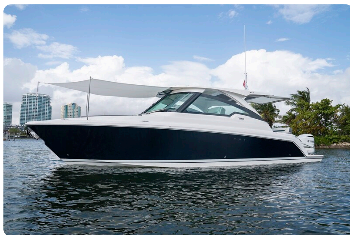
Tiara 34 LX bow profile