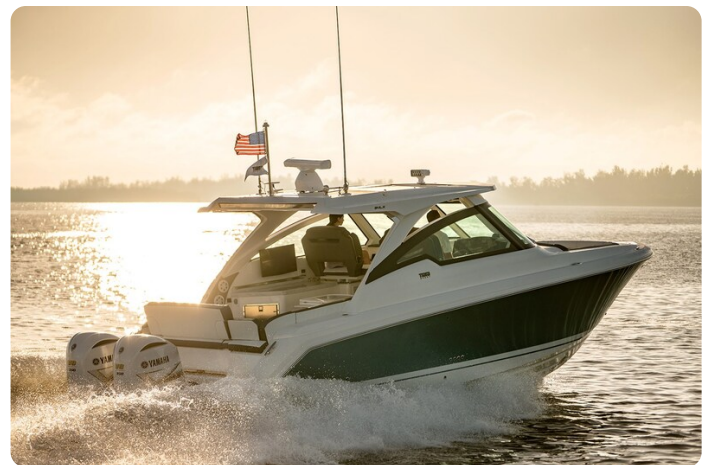
Tiara 34 LX running 2