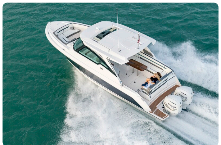
Tiara 34 LX Sport cruising