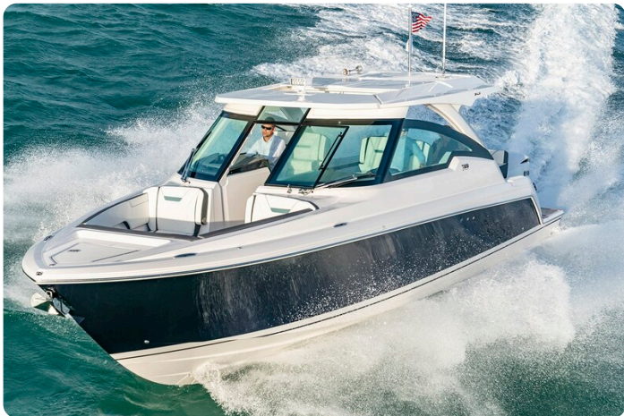
Tiara 34 LX Sport running