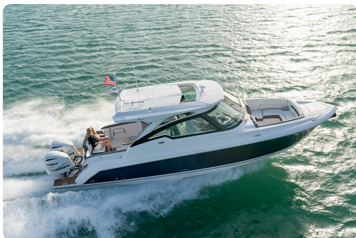
Tiara 34 LX cruising