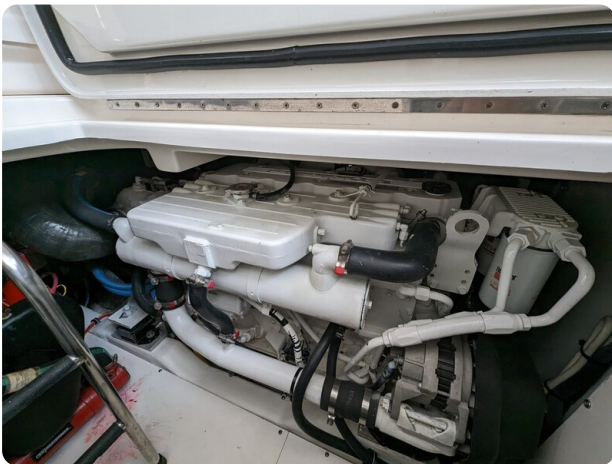
Tiara 3200 Open engine detail