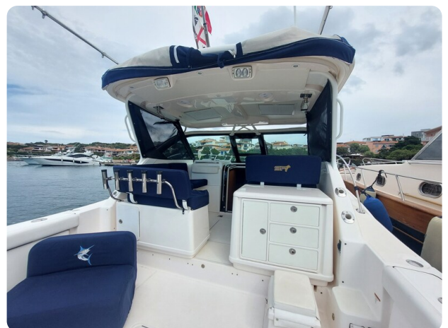
Tiara 3200 Open cockpit view