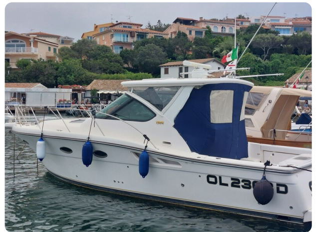
Tiara 3200 Open, aft profile