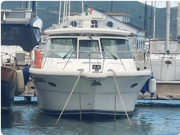
Tiara 3200 Open, bow view