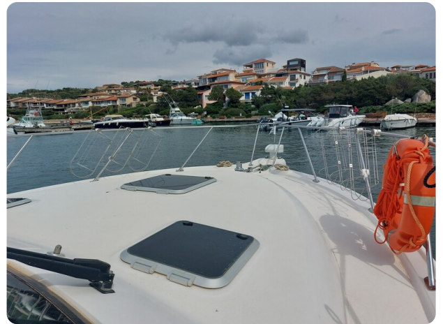
Tiara 3200 Open fwd deck