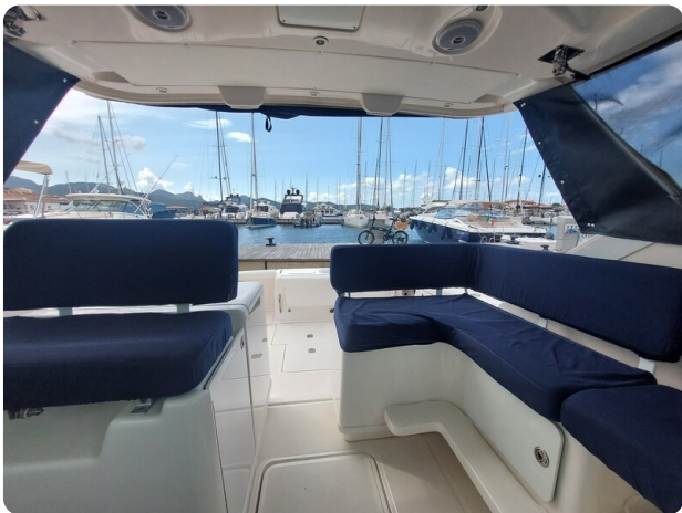
Tiara 3200 Open cockpit dinette