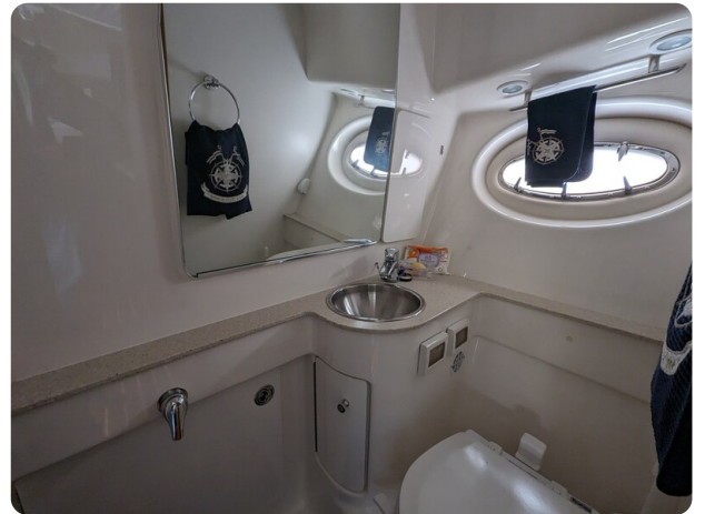
Tiara 3200 Open bathroom