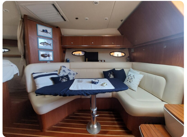
Tiara 3200 Open, dinette