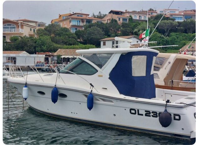
Tiara 3200 Open, aft profile