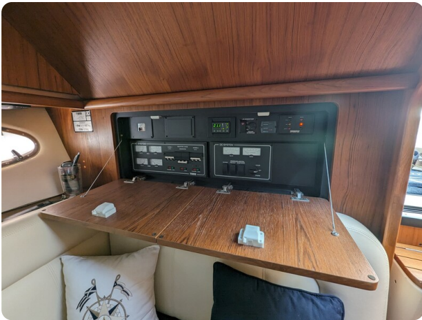
Tiara 3200 Open electrical panel