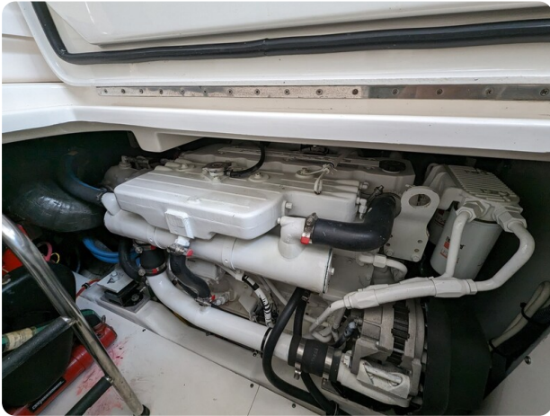
Tiara 3200 Open engine detail