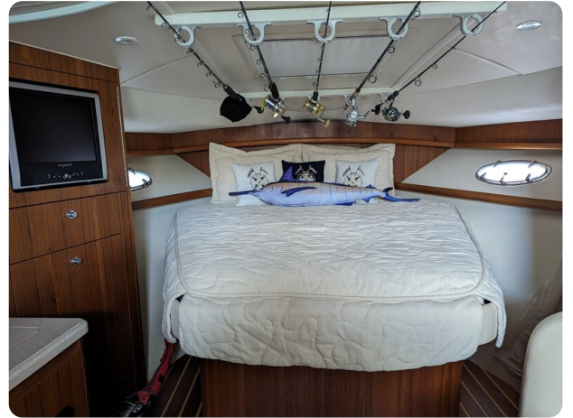
Tiara 3200 Open master berth