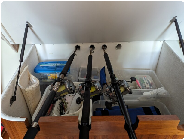
Tiara 3200 Open rods storage