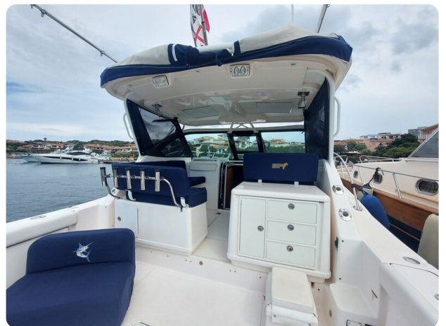
Tiara 3200 Open cockpit view