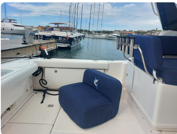
Tiara 3200 Open, cockpit