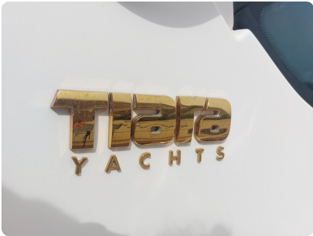
Tiara 3200 Open detail