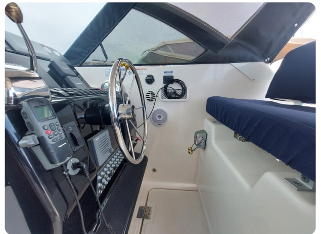
Tiara 3200 Open helm station