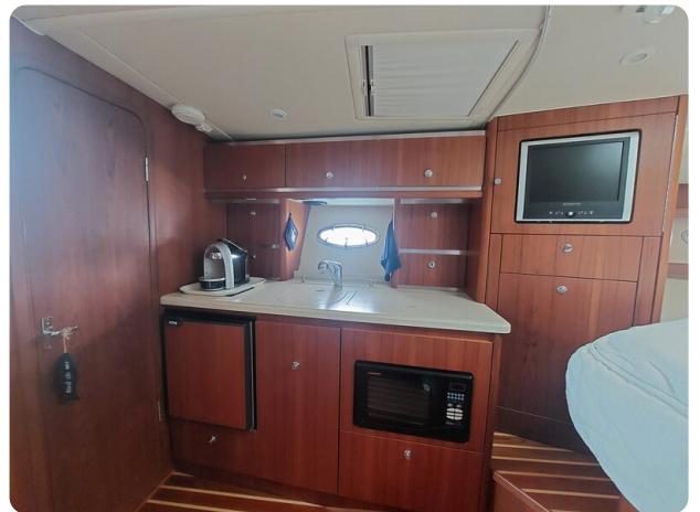
Tiara 3200 Open galley