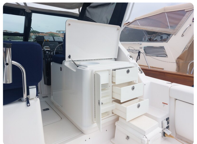
Tiara 3200 Open cockpit prep center