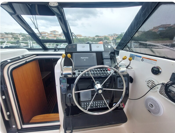
Tiara 3200 Open helm