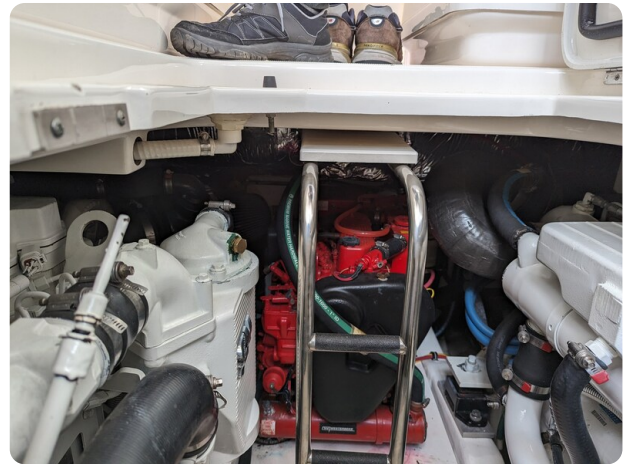
Tiara 3200 Open engine room