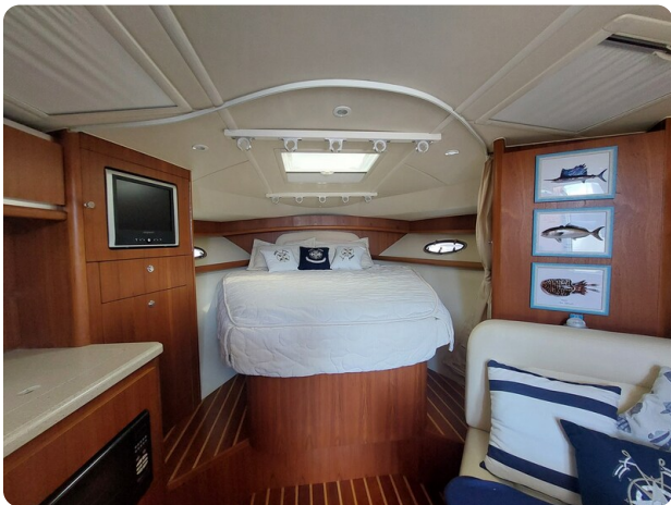
Tiara 3200 Open interiors