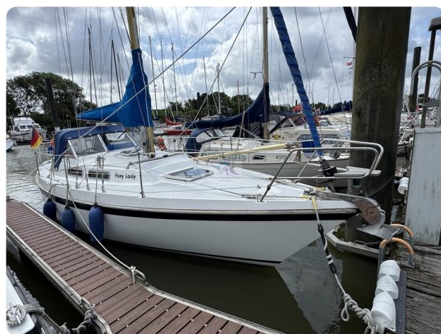
Targa 9.60m FOXY LADY 57