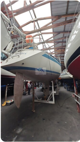
Sweden 340 SPITZMAUS 17