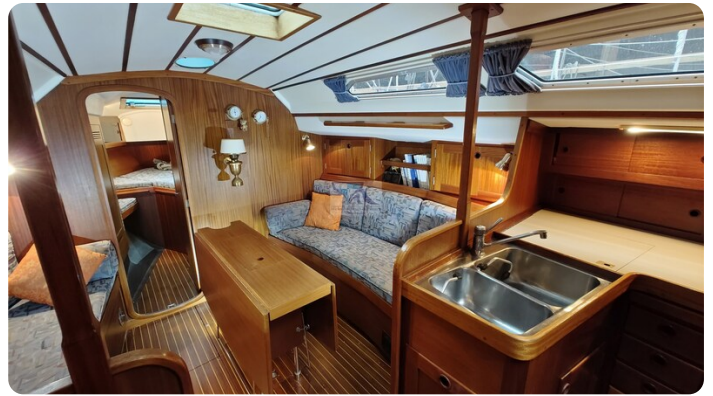
Sweden 340 SPITZMAUS 36