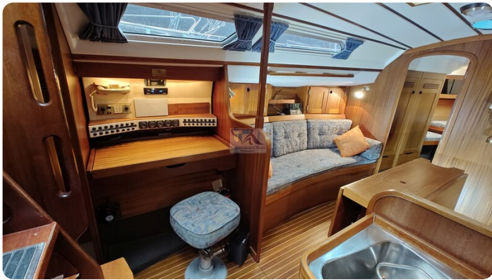
Sweden 340 SPITZMAUS 3