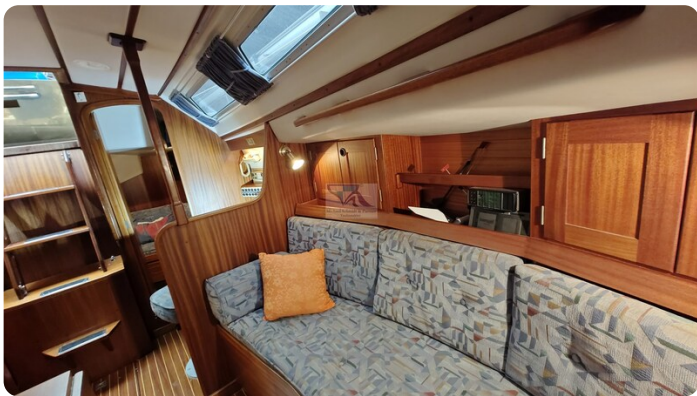
Sweden 340 SPITZMAUS 21