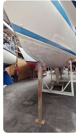
Sweden 340 SPITZMAUS 15