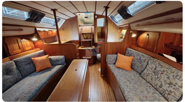
Sweden 340 SPITZMAUS 55