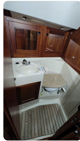
Sweden 340 SPITZMAUS 41