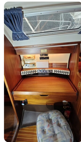
Sweden 340 SPITZMAUS 5