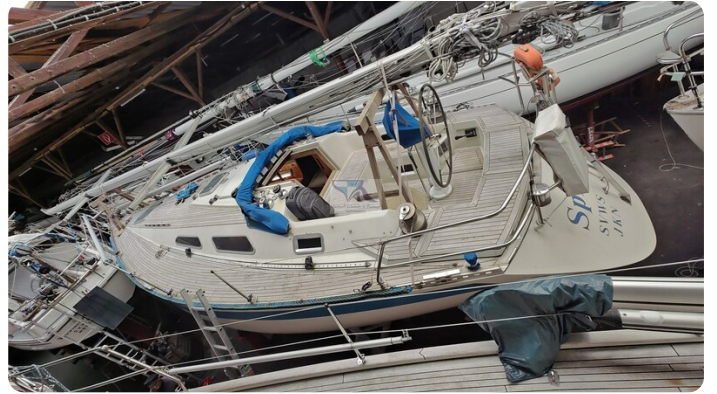
Sweden 340 SPITZMAUS 69