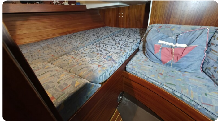
Sweden 340 SPITZMAUS 60