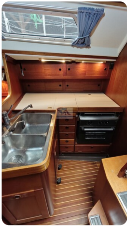
Sweden 340 SPITZMAUS 9