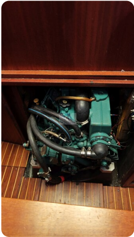
Sweden 340 SPITZMAUS 44