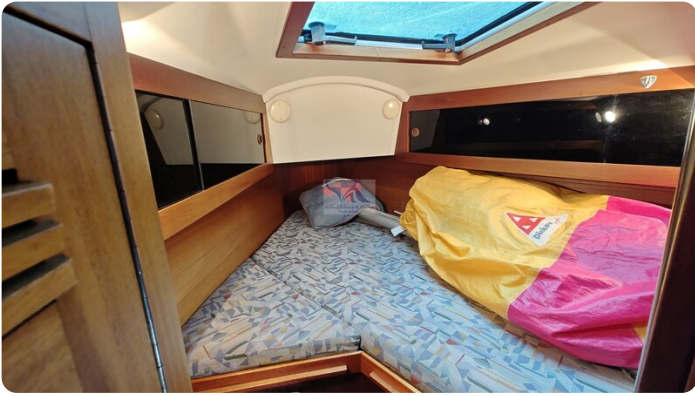
Sweden 340 SPITZMAUS 40