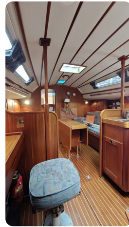
Sweden 340 SPITZMAUS 42