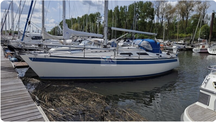
Sweden 340 SPITZMAUS IW 2