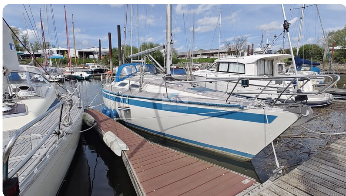
Sweden 340 SPITZMAUS IW 6