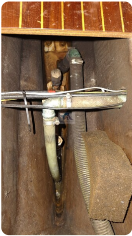
Sweden 340 SPITZMAUS 29