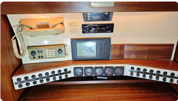
Sweden 340 SPITZMAUS 6