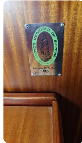
Sweden 340 SPITZMAUS 59