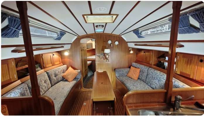
Sweden 340 SPITZMAUS 2