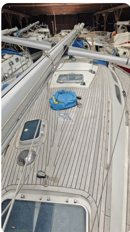
Sweden 340 SPITZMAUS 1