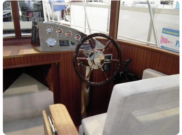
Hausboot SM 30 msp-398859 (19)