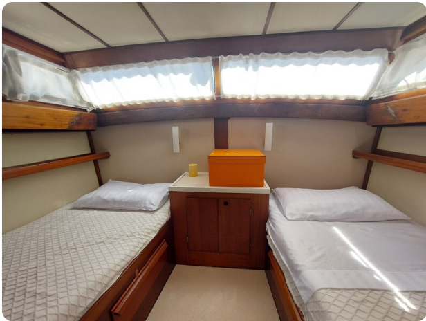
Storebro vip cabin1