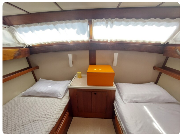
Storebro vip cabin