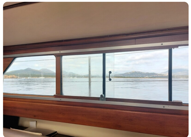
Storebro wide side windows