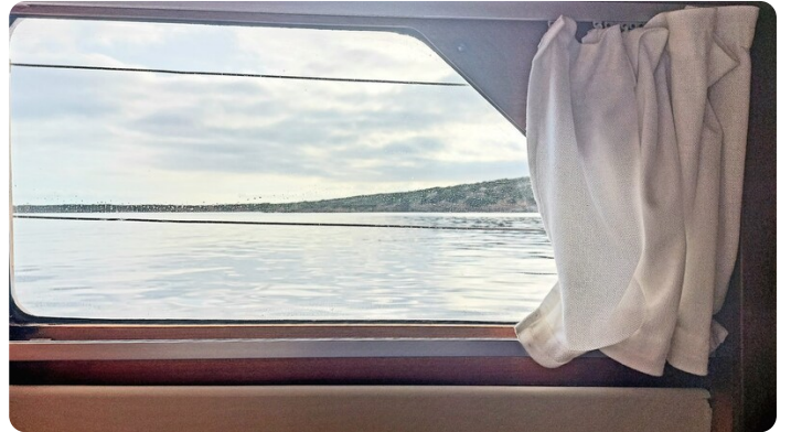
Storebro wc wide side windows