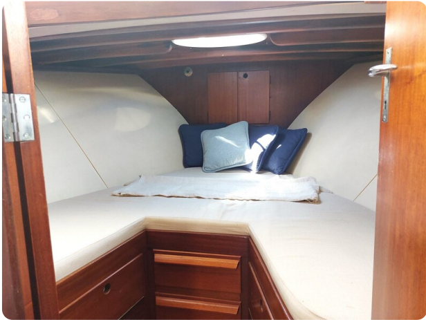
Storebro master cabin