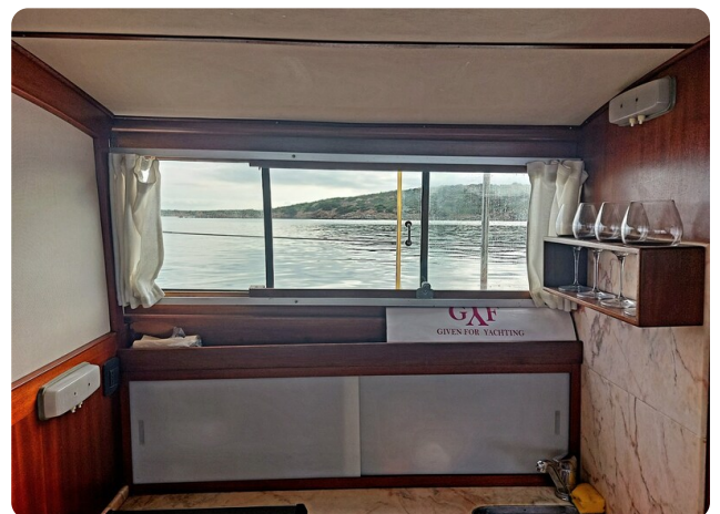
Storebro galley detail