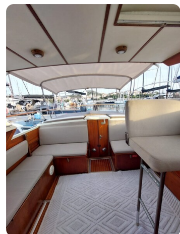
Storebro 34 exterior dinette