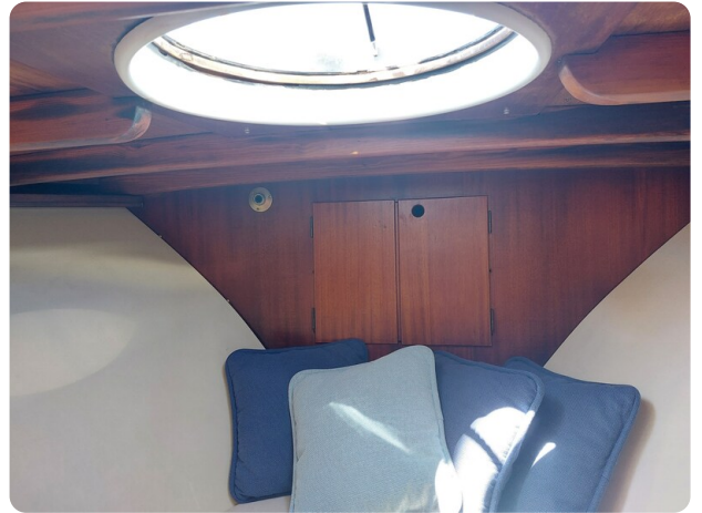
Storebro detail cabin