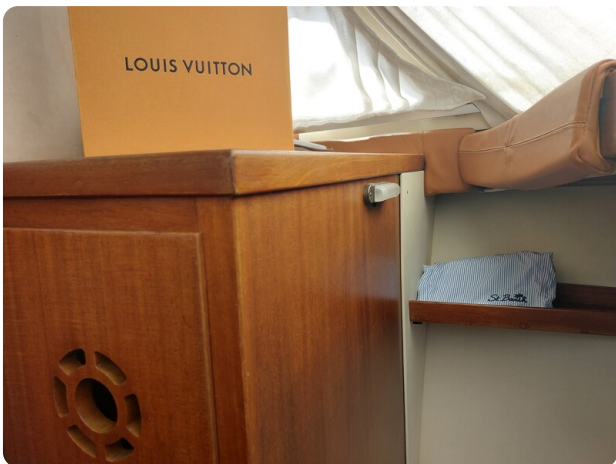
Storebro storage cabin