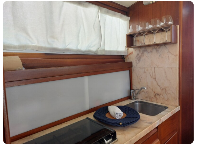
Storebro galley detail