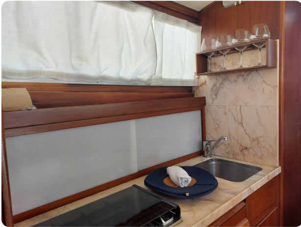
Storebro galley detail