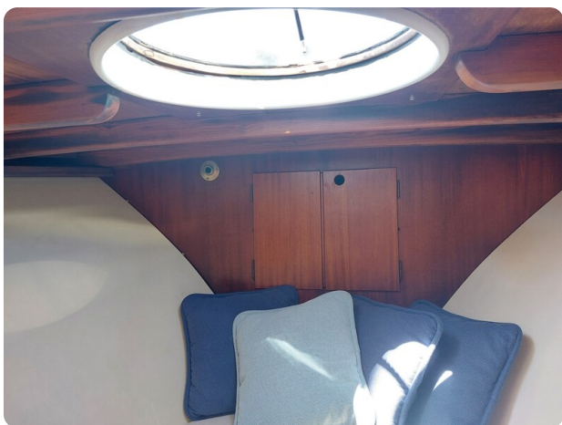
Storebro detail cabin