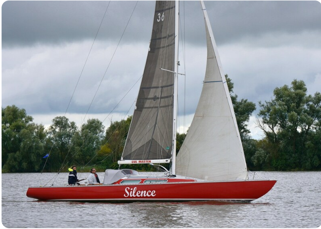
Senatspreis 2021 DSC_7515[17636]