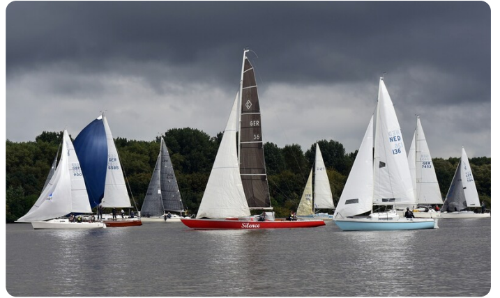
Senatspreis 2021 DSC_7438[17633]