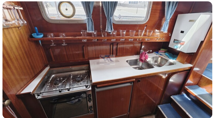
Nauticat 33 NORDSTRAND 51