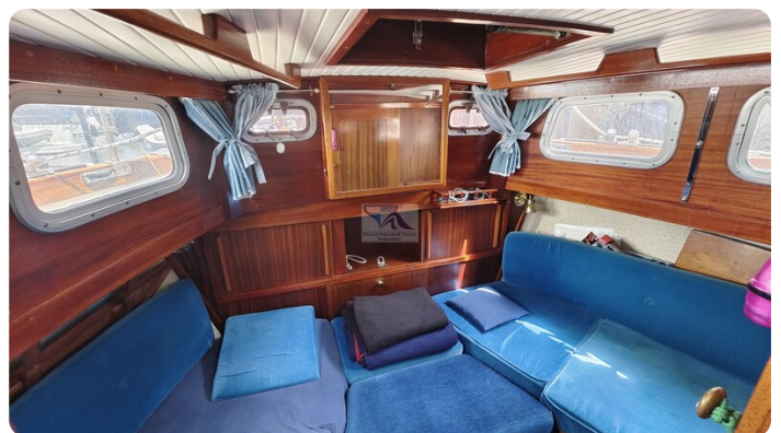
Nauticat 33 NORDSTRAND 57