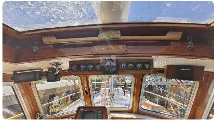
Nauticat 33 NORDSTRAND 27