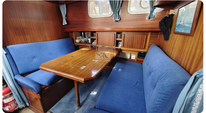
Nauticat 33 NORDSTRAND 45