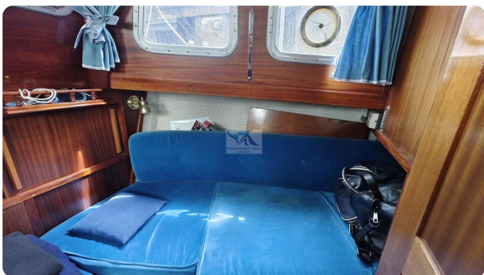
Nauticat 33 NORDSTRAND 52