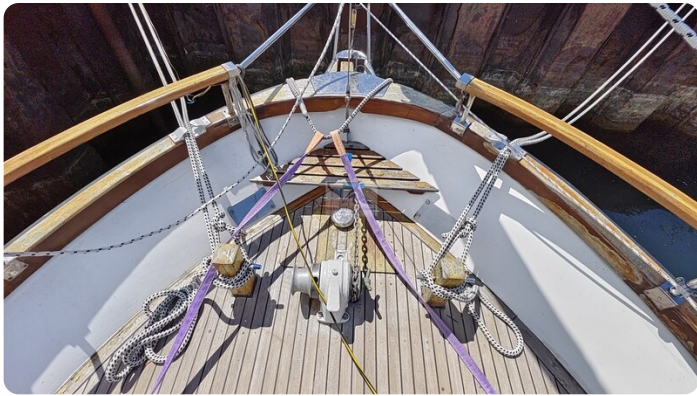
Nauticat 33 NORDSTRAND 13