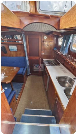
Nauticat 33 NORDSTRAND 40