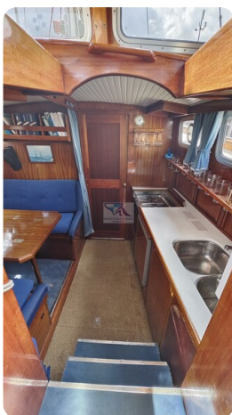
Nauticat 33 NORDSTRAND 40