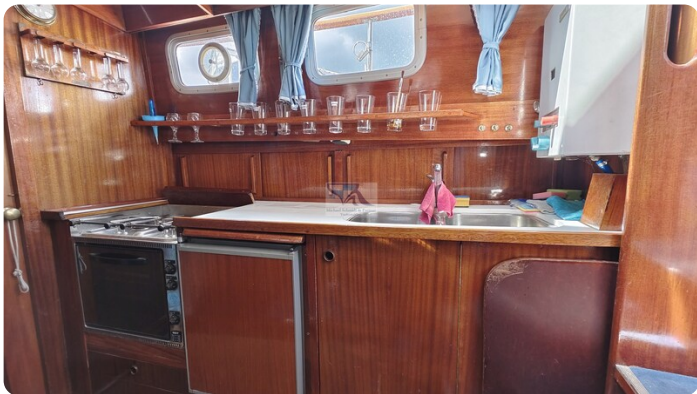
Nauticat 33 NORDSTRAND 47