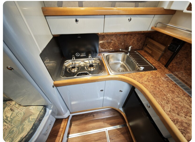
Sealine 28 BELLA 34