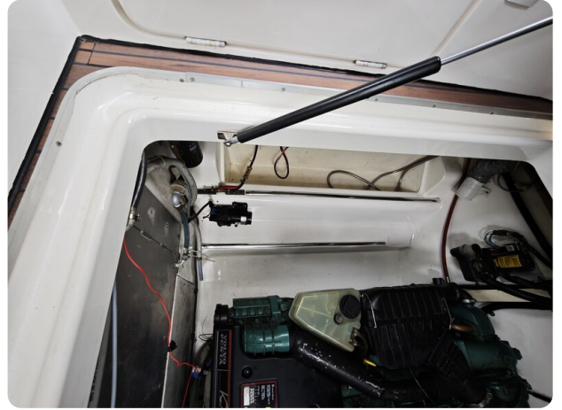
Sealine 28 BELLA 3