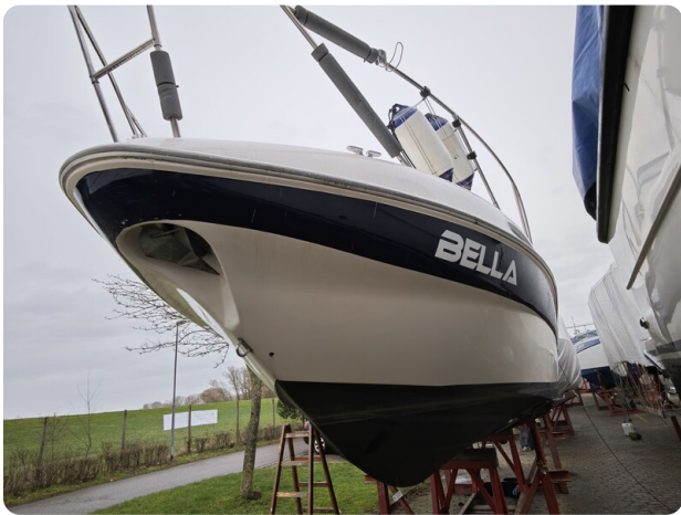
Sealine 28 BELLA 63