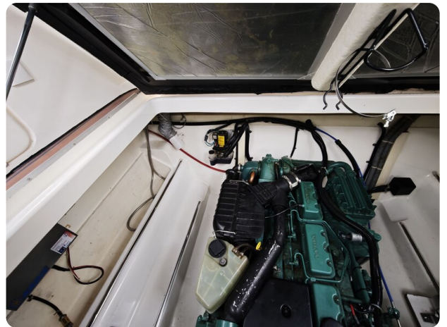
Sealine 28 BELLA 7