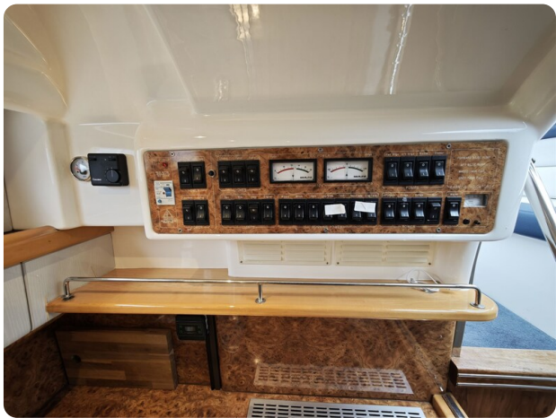
Sealine 28 BELLA 38