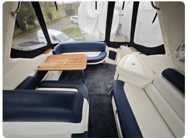
Sealine 28 BELLA 40