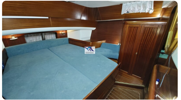
Sunbeam 39 147