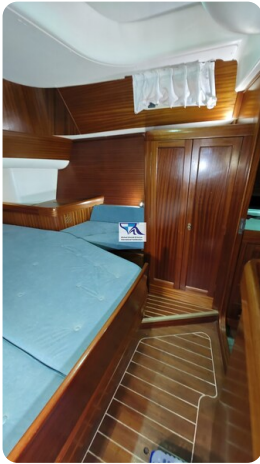
Sunbeam 39 149