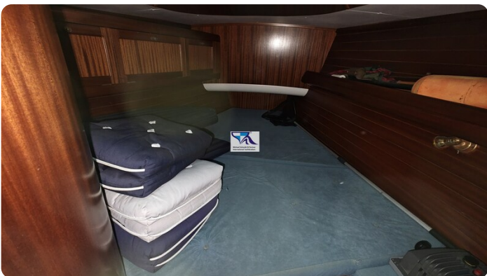
Sunbeam 39 153