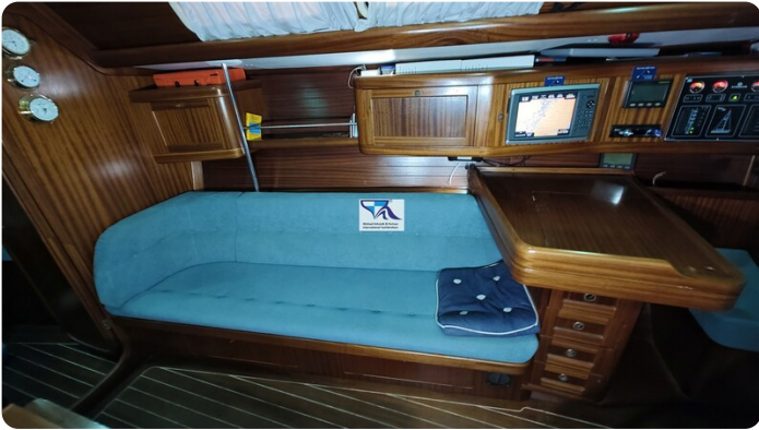
Sunbeam 39 138