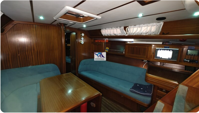
Sunbeam 39 132