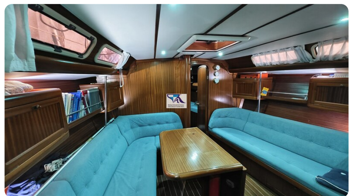
Sunbeam 39 129