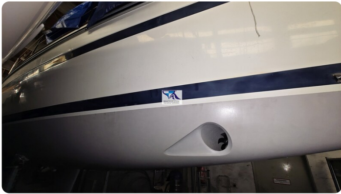
Sunbeam 39 86