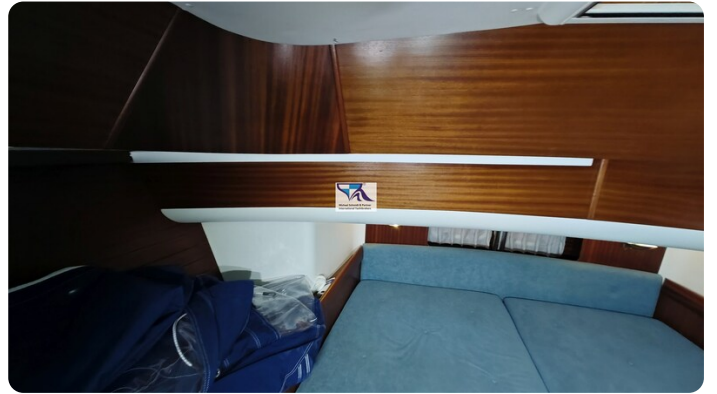
Sunbeam 39 151