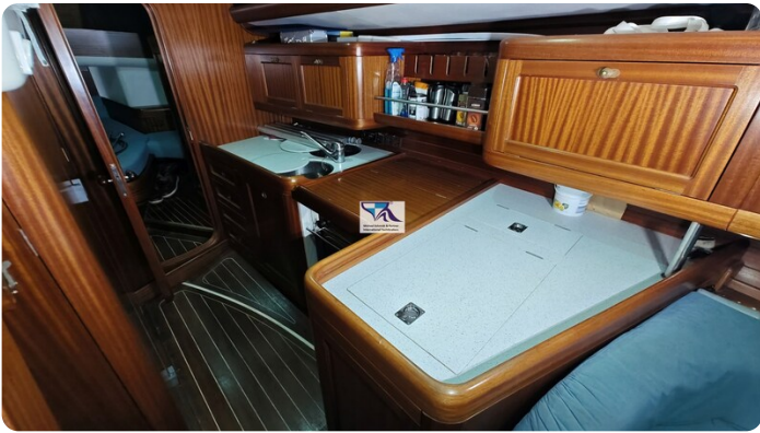
Sunbeam 39 144