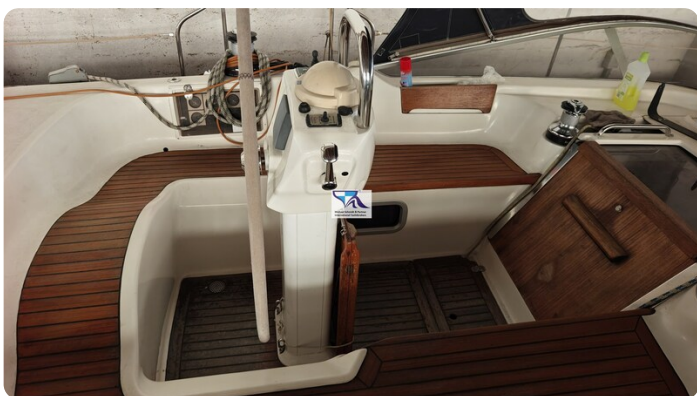
Sunbeam 39 105