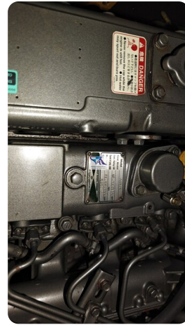
Sunbeam 39 156