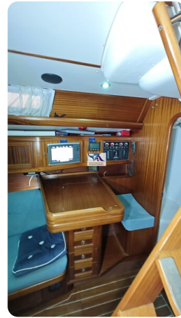
Sunbeam 39 134