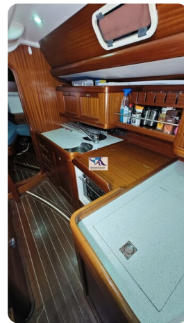
Sunbeam 39 142