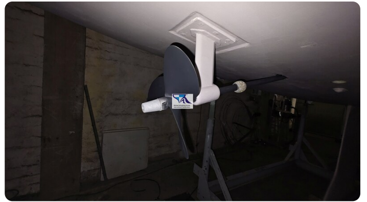
Sunbeam 39 90