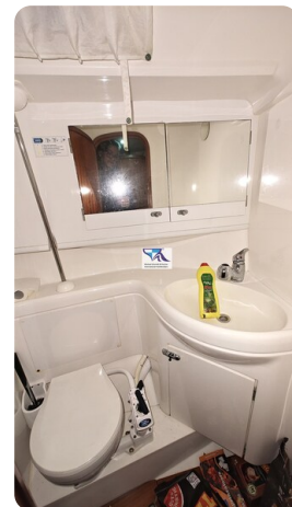
Sunbeam 39 154