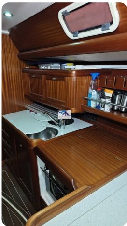
Sunbeam 39 141