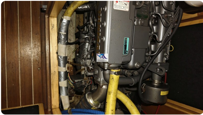
Sunbeam 39 155