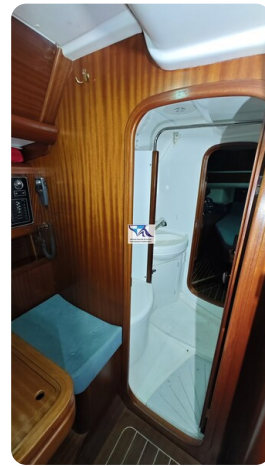
Sunbeam 39 140