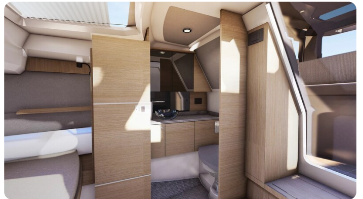
Saxdor 340 WA head