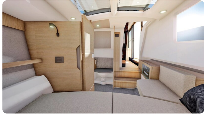
Saxdor 340 WA interiors