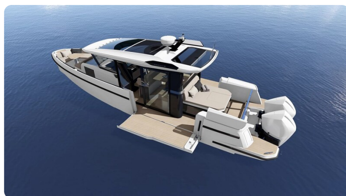
Saxdor 340 WA opened wings