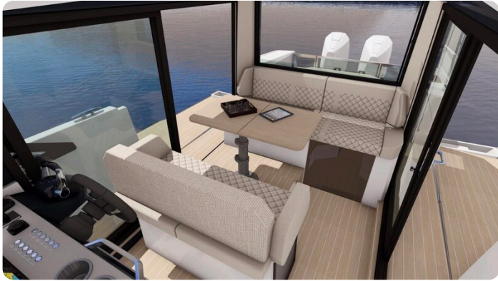
Saxdor 340 WA cockpit dinette