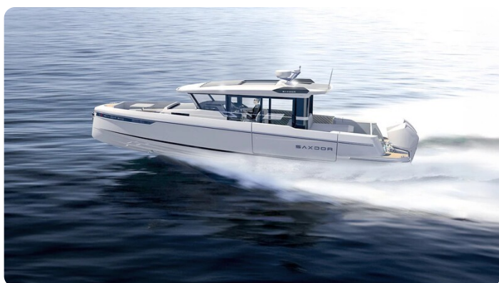
Saxdor 340 WA running