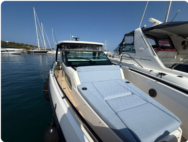
Saxdor 320 GTO Bow