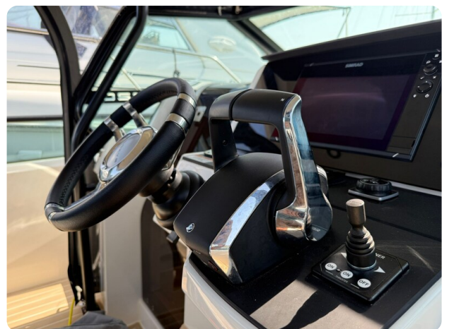
Saxdor 320 GTO Helm console detail