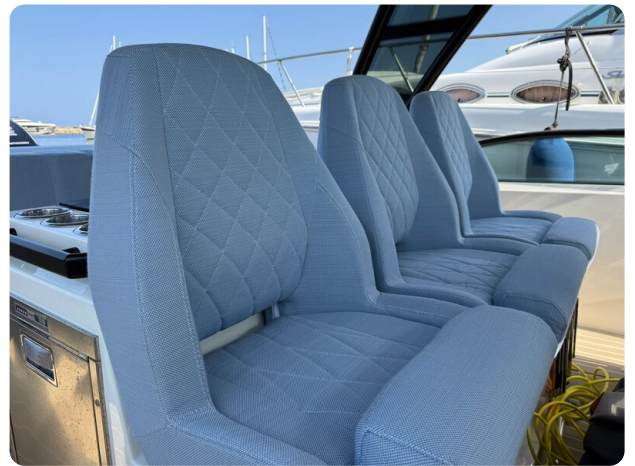
Saxdor 320 GTO Front Seats