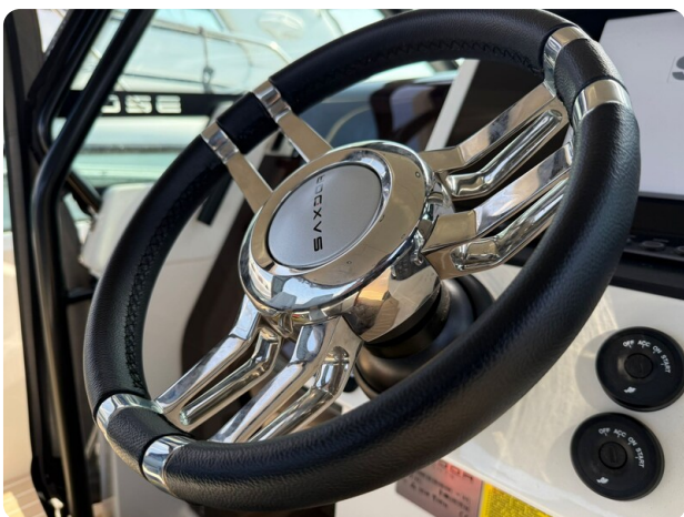
Saxdor 320 GTO Wheel