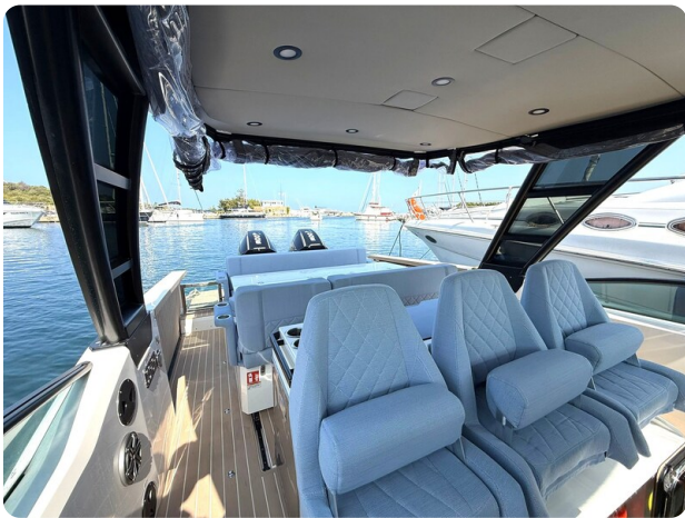
Saxdor 320 GTO Cockpit