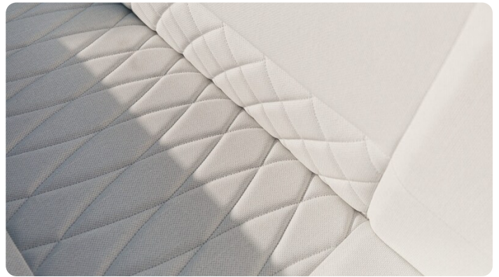
SAXDOR 270 GTO Sofa detail