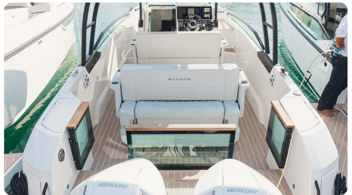
SAXDOR 270 GTO Stern