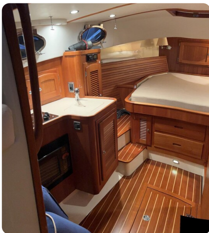
San Juan 40, lower deck