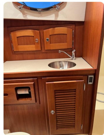
San Juan 40 bathroom