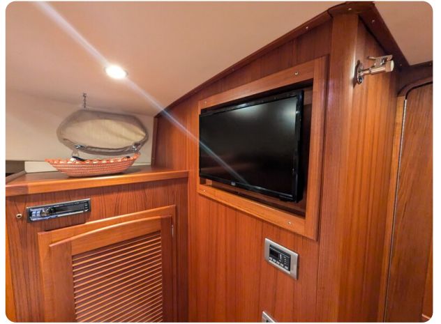
San Juan 48 master cabin Tv