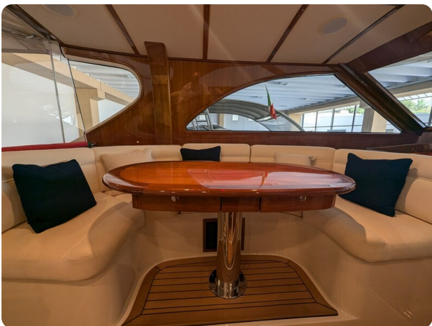
San Juan 48 dinette