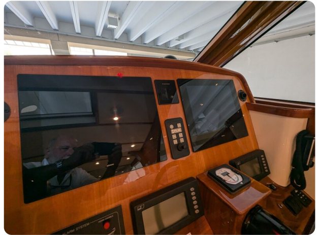
San Juan 48 helm detail