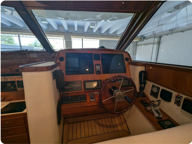
San Juan 48 helm station