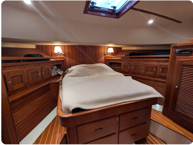
San Juan 48 master cabin