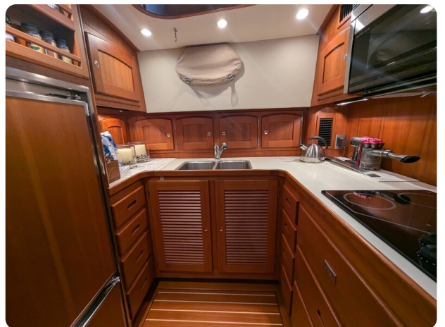
San Juan 48 galley