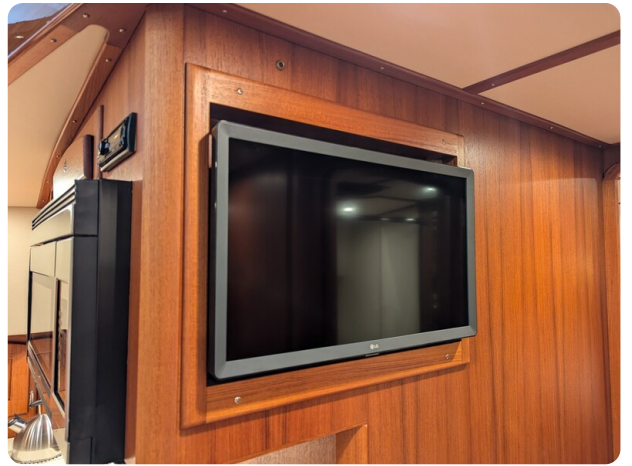
San Juan 48 lower dinette Tv