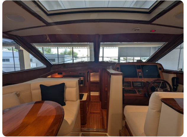
San Juan 48 dinette view