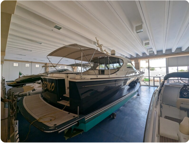
San Juan 48 drydock