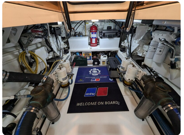
San Juan 48 engine room