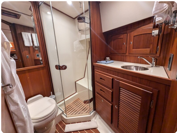
San Juan 48 bathroom