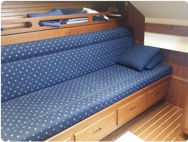
San Juan 48 lower dinette