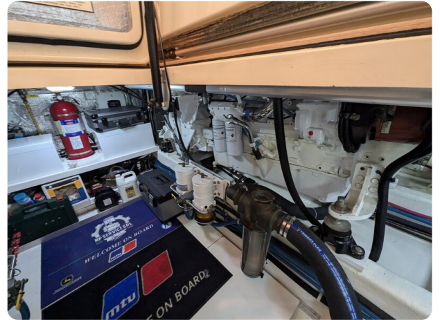
San Juan 48 engine room detail