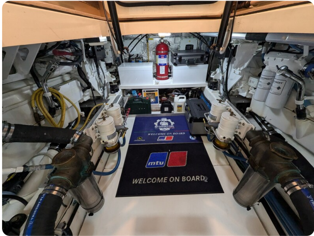
San Juan 48 engine room