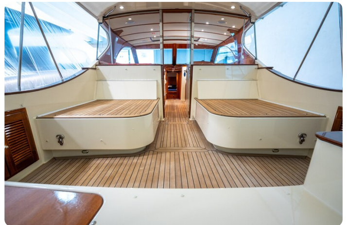
San Juan 48 cockpit