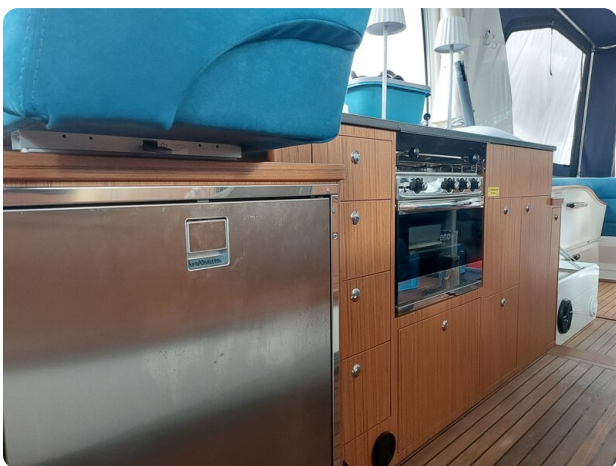
Saga 390 HT.jpg