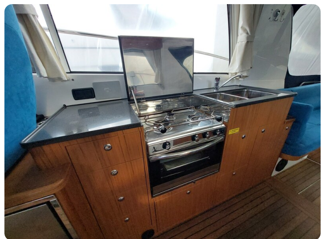
Saga 390 HT.jpg