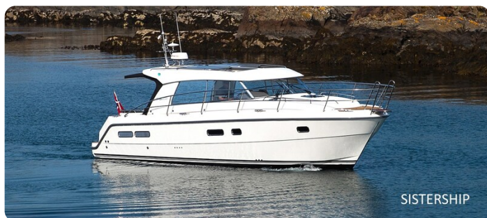
Saga 39 HT sistership