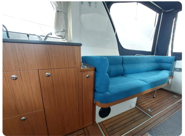
Saga 390 HT.jpg