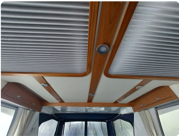
Saga 390 HT.jpg