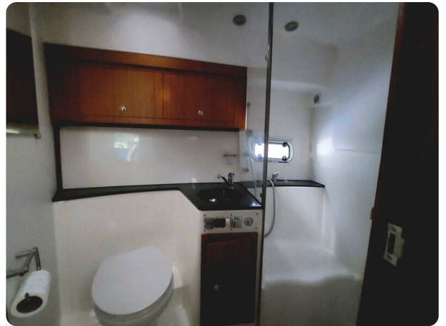
Saga 390 HT toilette