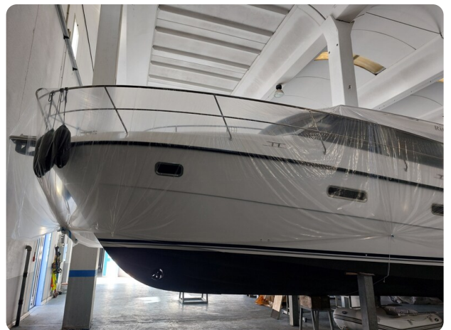
Saga 390 HT.jpg