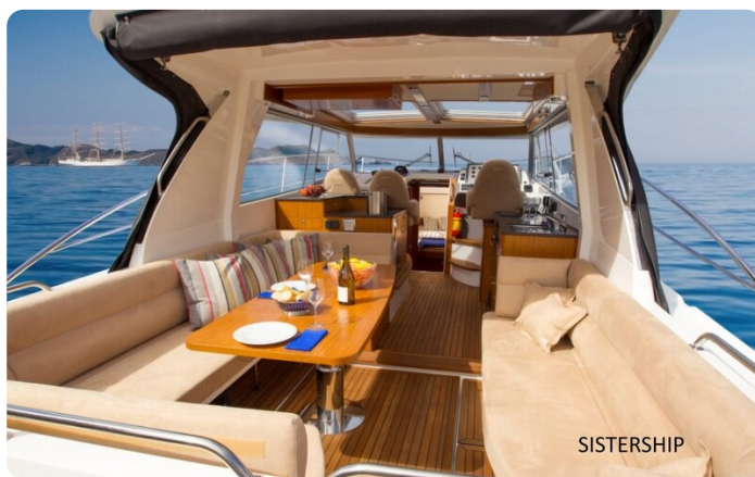
Saga 390 HT Sistership 2.jpg