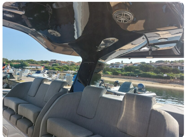
sacs strider 15-14