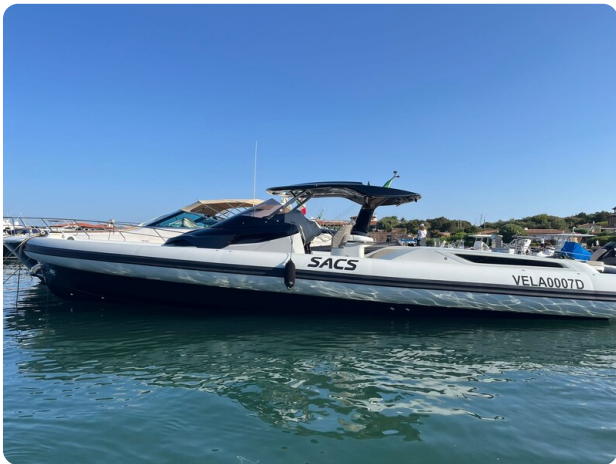
sacs strider 15-45