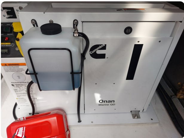
sacs strider 15-24