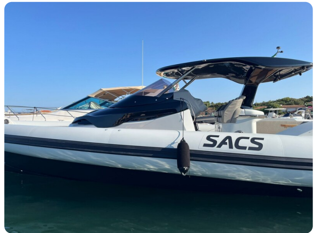
sacs strider 15-36