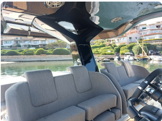
sacs strider 15-13