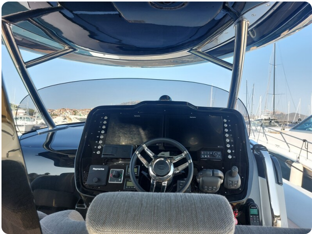
sacs strider 15-22