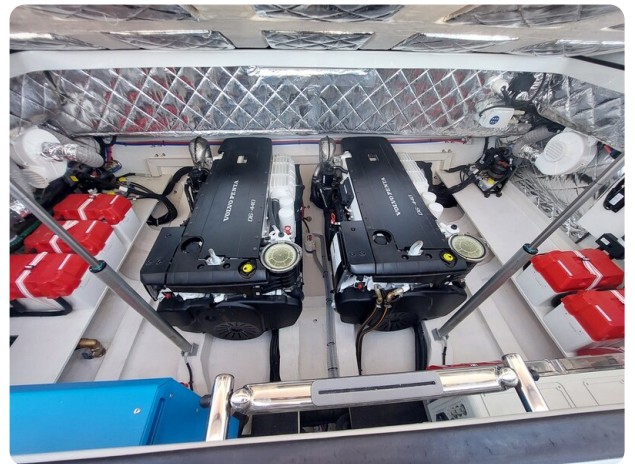
sacs strider 15-25