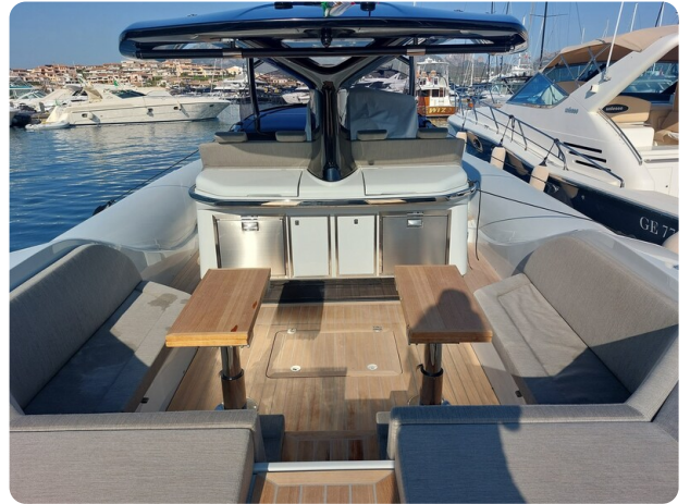
sacs strider 15-5