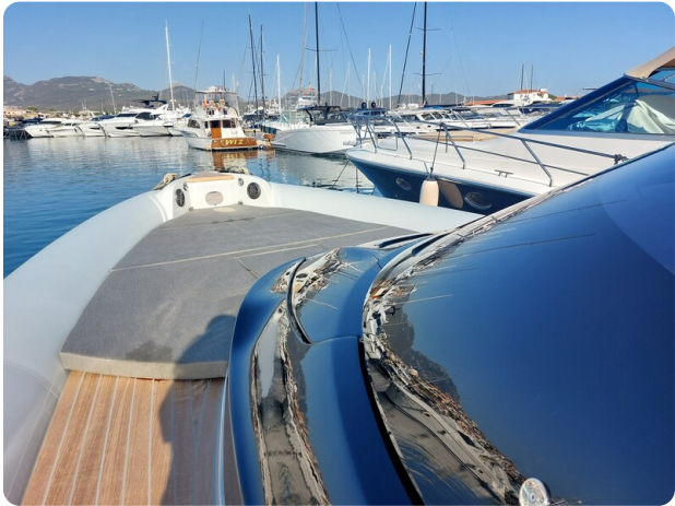
sacs strider 15-18