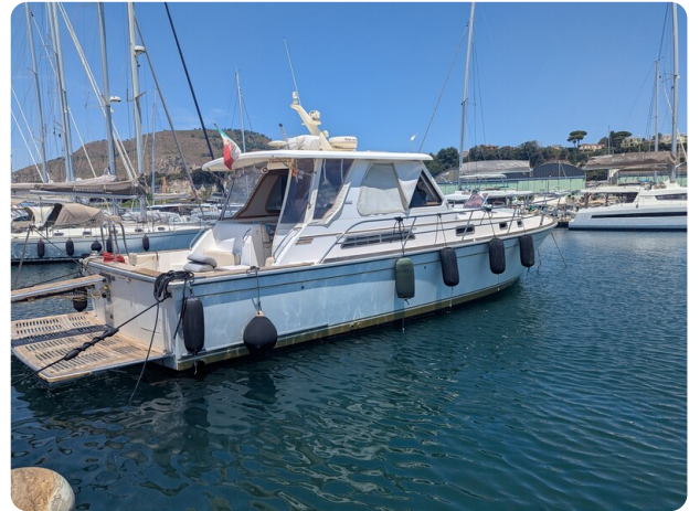
Sabre 42 Express profile