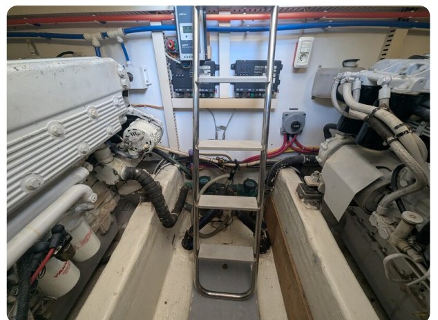
Sabre 42 Express engine room