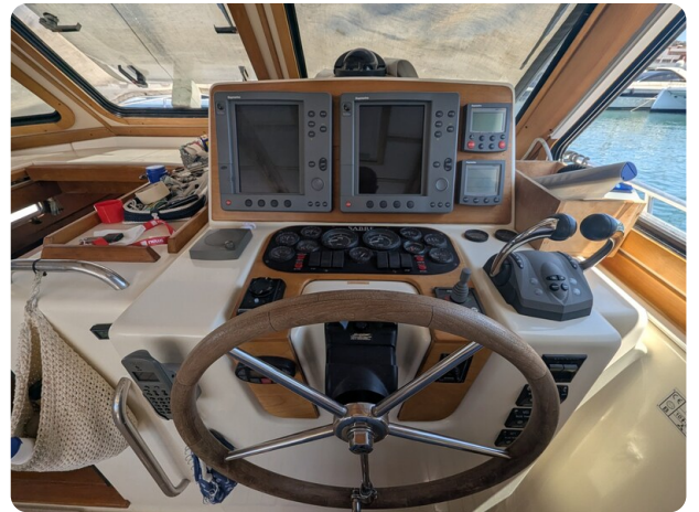
Sabre 42 Express Helm