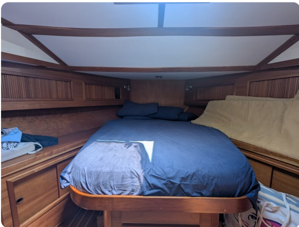
Sabre 42 Express owner's berth