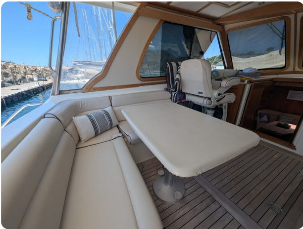
Sabre 42 Express cockpit dinette