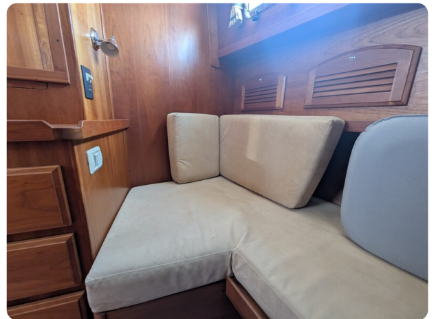
Sabre 42 Express convertible second cabin