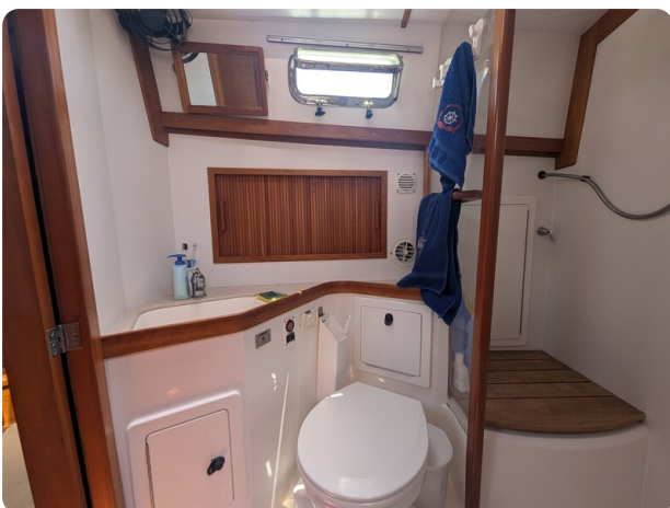
Sabre 42 Express bathroom