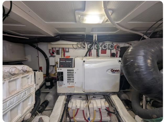
Sabre 42 Express engine room detail