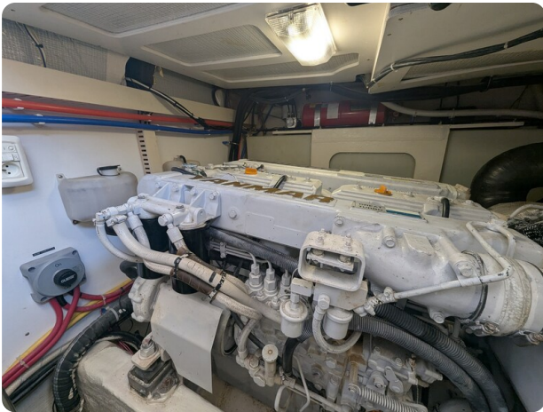
Sabre 42 Express engine detail