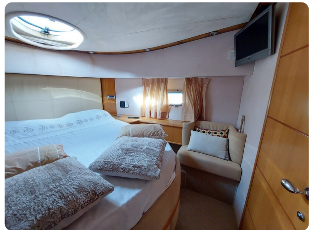
Rodman Yacht 64 Belisa cabina vip dettaglio