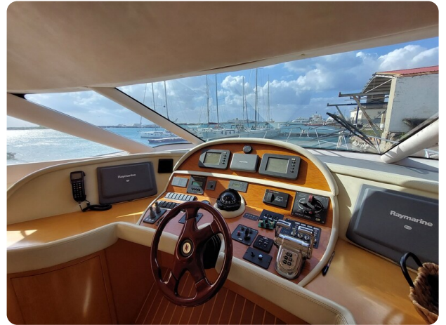
Rodman Yacht 64 Belisa, plancia comandi interno1