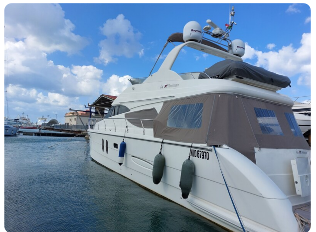
Rodman Yacht 64 Belisa, profile2