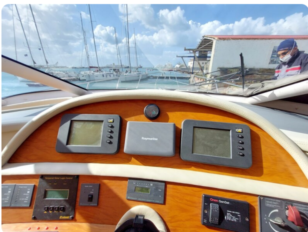
Rodman Yacht 64 Belisa, strumenti 1