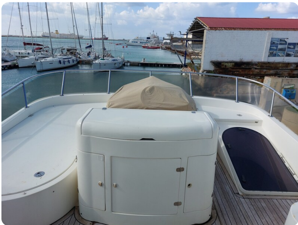
Rodman Yacht 64 Belisa, fly 1