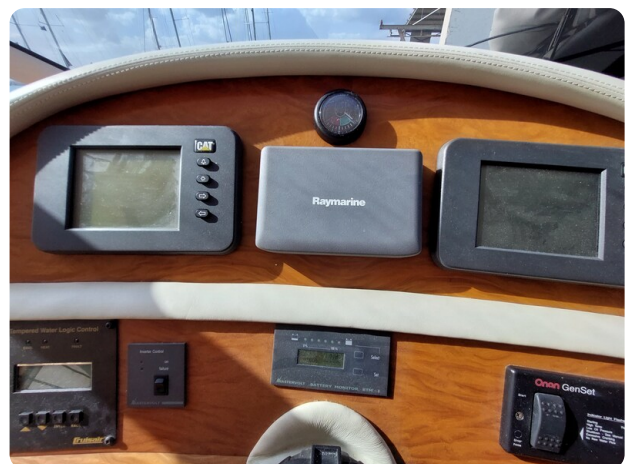
Rodman Yacht 64 Belisa, strumenti