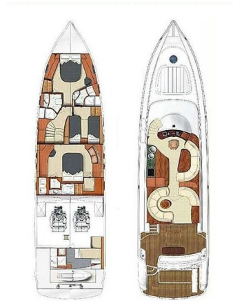
Rodman 64, Belisa, layout