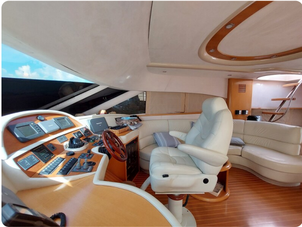
Rodman Yacht 64 Belisa, interno guida e salone