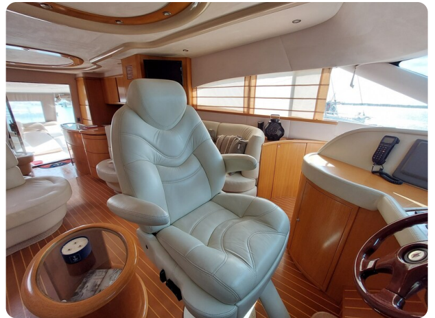
Rodman Yacht 64 Belisa, guida 3