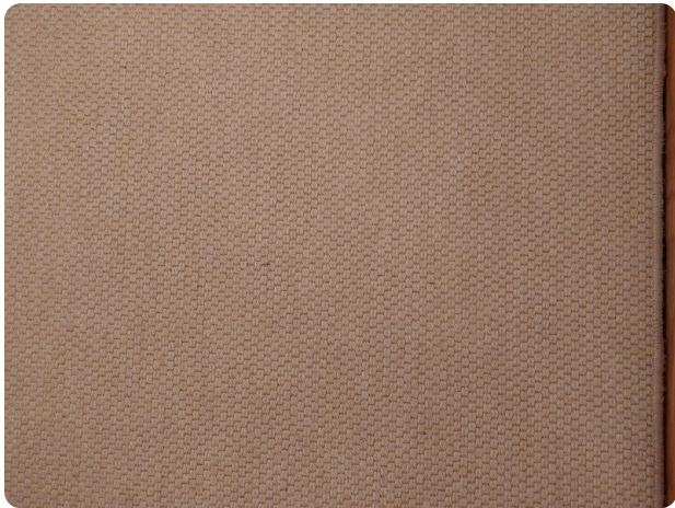
Rodman Yacht 64 Belisa, dettaglio moquette