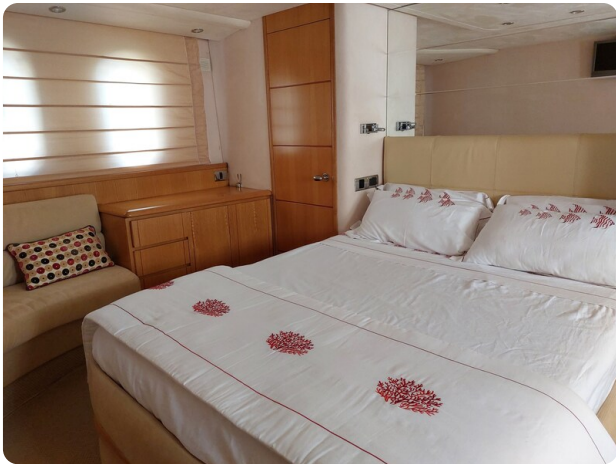
Rodman Yacht 64 Belisa, cabina armatoriale