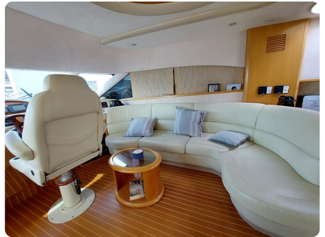
Rodman Yacht 64 Belisa, salone e guida