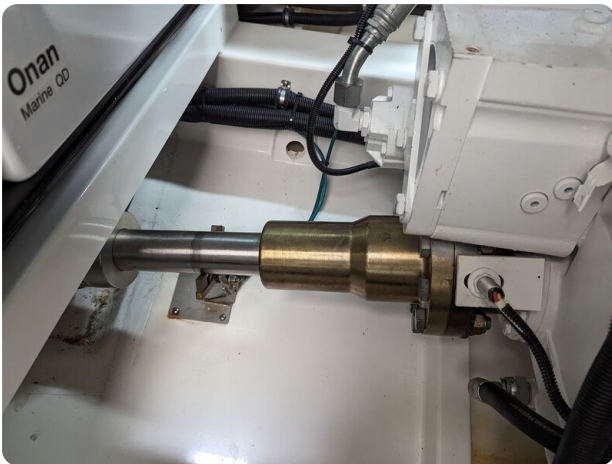
Riviera 45 Fly engine shaft detail