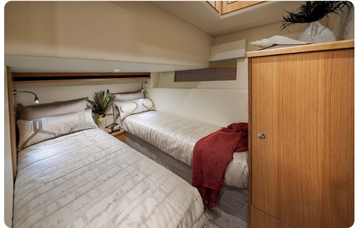
Riviera 45 Fly guest cabin, convertible