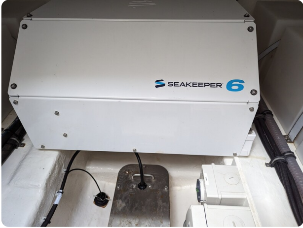
Riviera 45 Fly Seakeeper