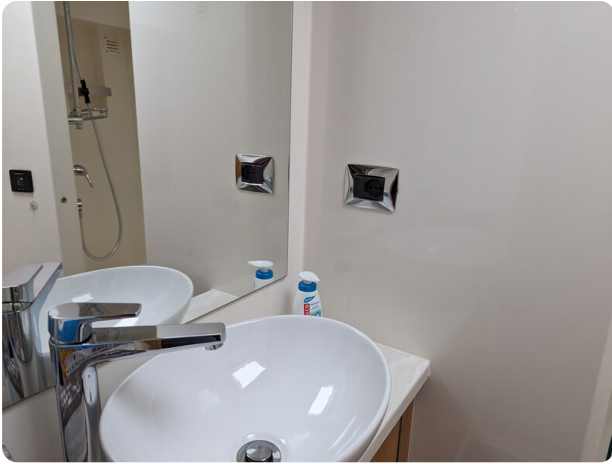
Riviera 45 Fly guest bathroom