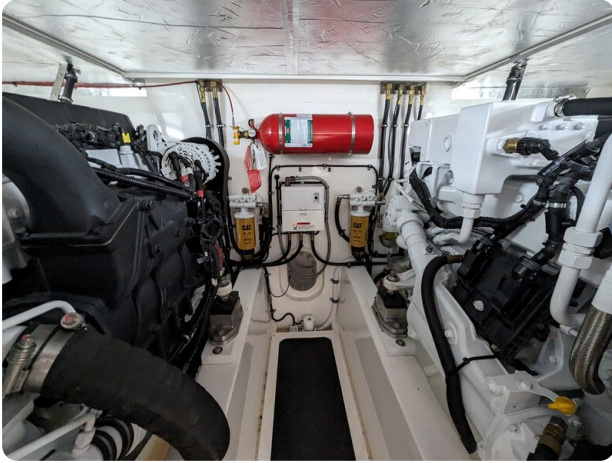
Riviera 45 Fly engine room