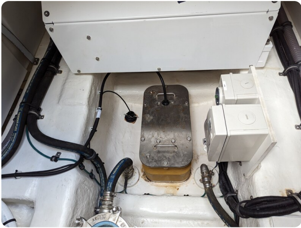
Riviera 45 Fly echo transducer