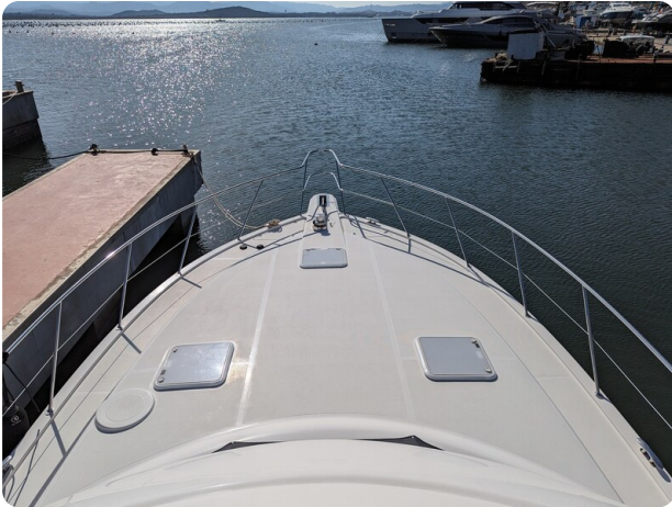
Riviera 45 Fly fwd deck