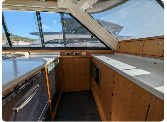
Riviera 45 Fly galley