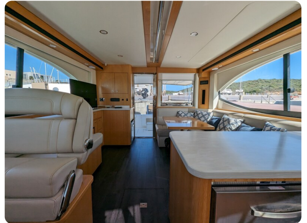
Riviera 45 Fly salon to aft