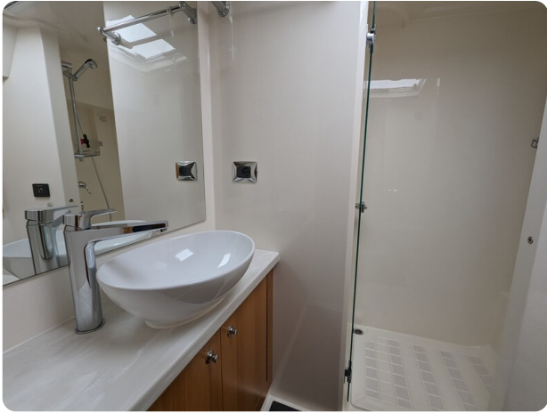
Riviera 45 Fly owner's bathroom