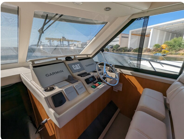
Riviera 45 Fly helm station