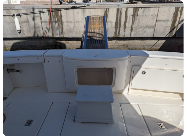
Riviera 45 Fly live baitwell