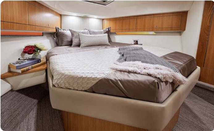
Riviera 45 Open Flybridge owner's cabin