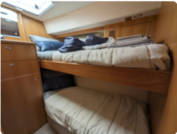
Riviera 45 Fly pullman berth cabin