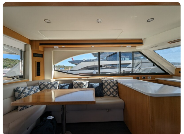
Riviera 45 Fly dinette