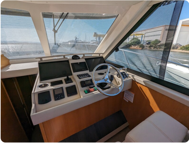
Riviera 45 Fly helm station detail