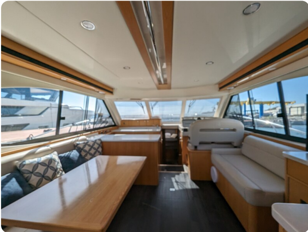
Riviera 45 Fly salon view