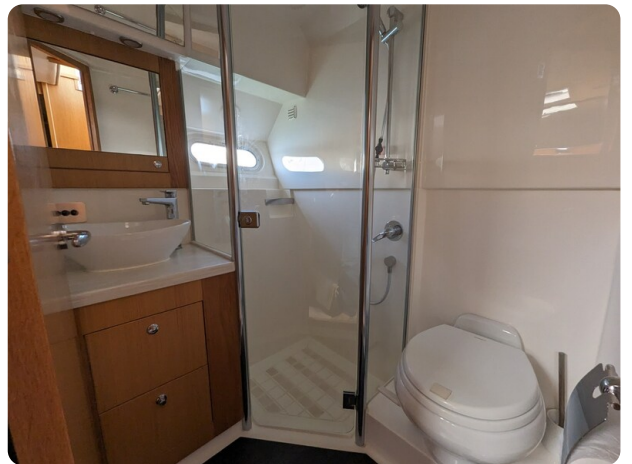
Riviera 45 Fly guest bathroom