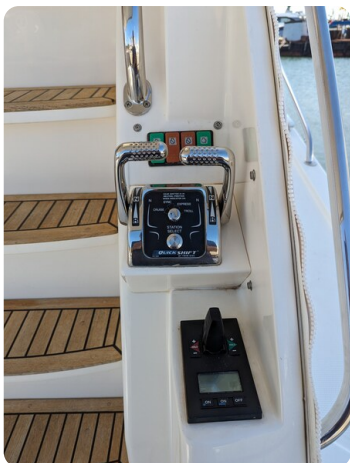
Riviera 45 Fly cockpit controls