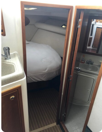
Riviera 33 fly toilet