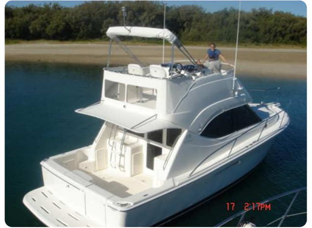
Riviera Marine Sister ship 1