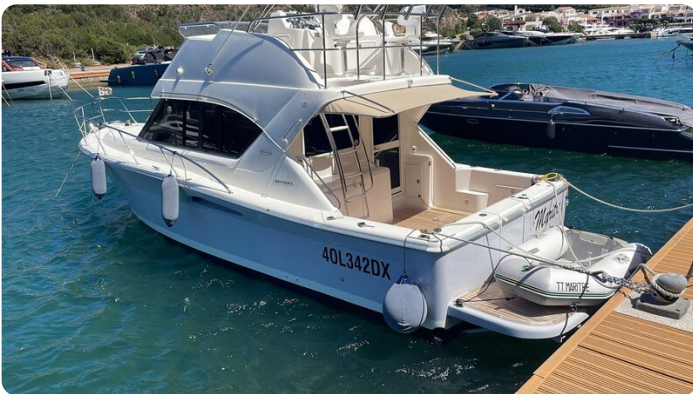
Riviera 33 fly lateral view