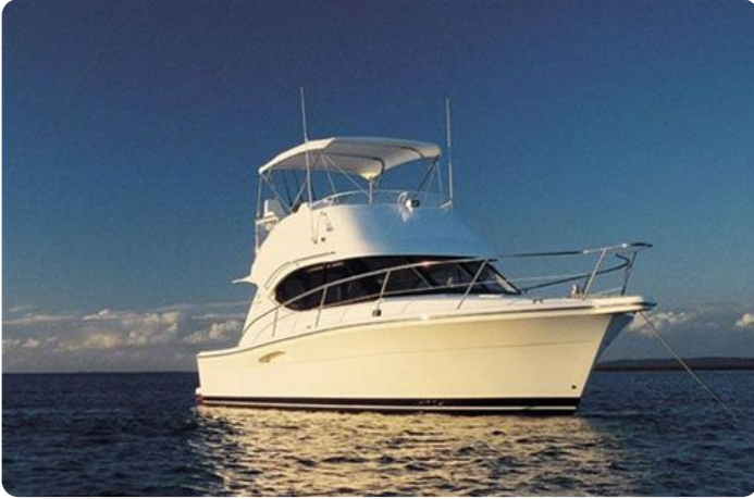
Riviera Marine Sister ship