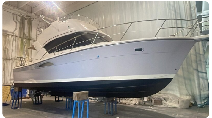
Riviera 33 fly hull 1