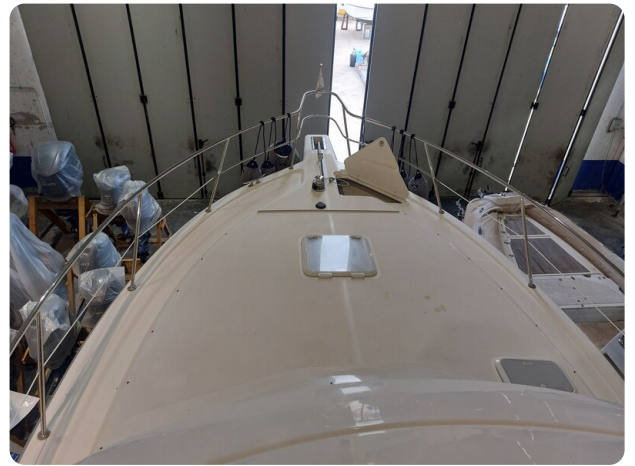
Riviera 33 fly bow