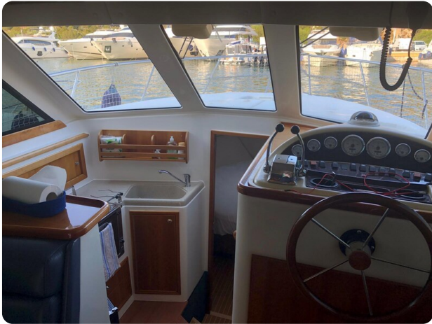
Riviera 33 fly cockpit