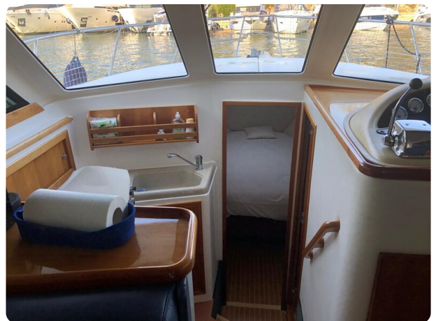
Riviera 33 fly cabin