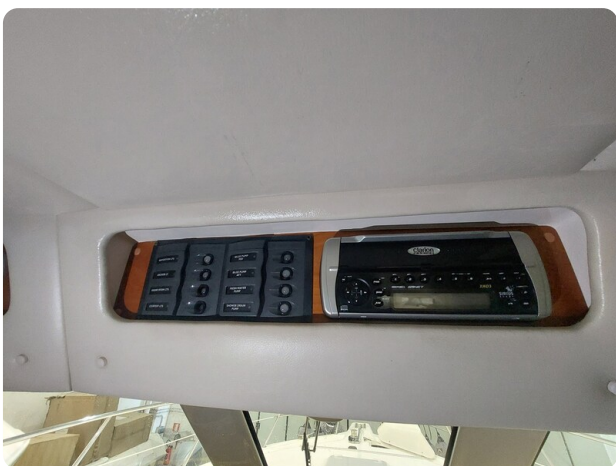
Riviera 33 fly Riviera 33 fly VHF