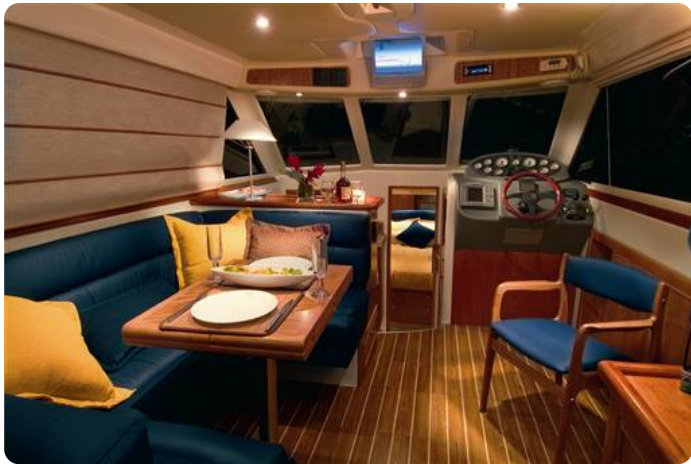
6Riviera 33 fly interior 1