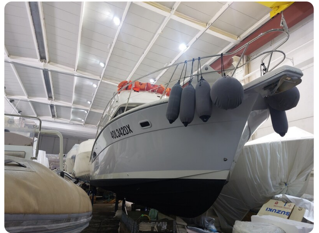
Riviera 33 fly hull