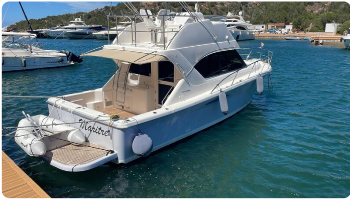
Riviera 33 fly lateral view1