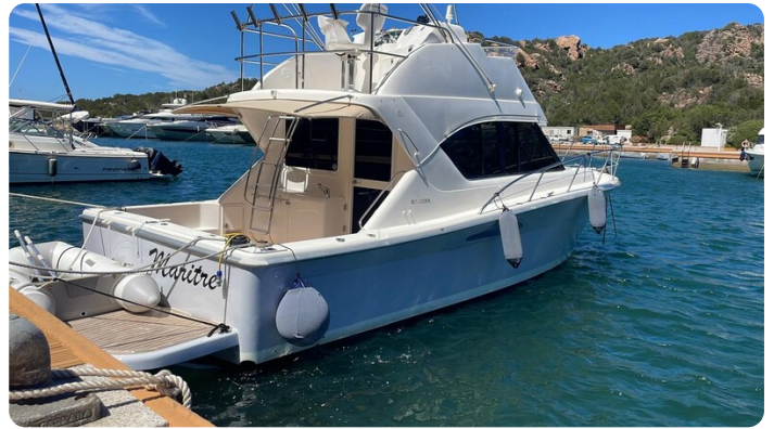
Riviera 33 fly exterior