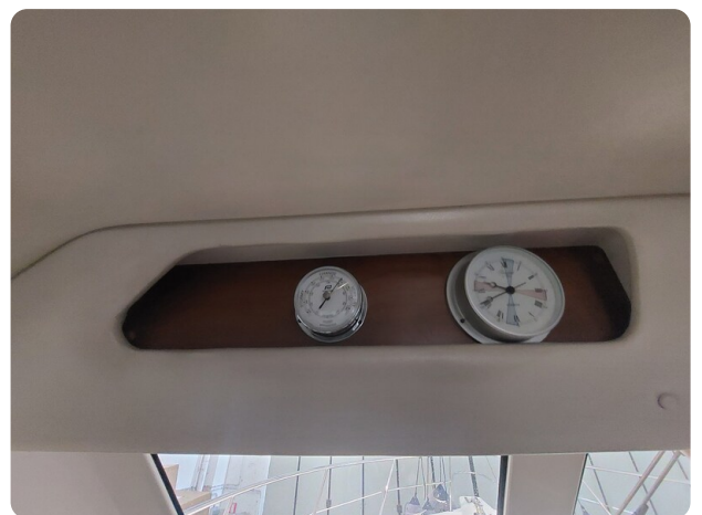
Riviera 33 fly detail