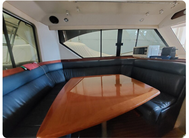
Riviera 33 fly dinette