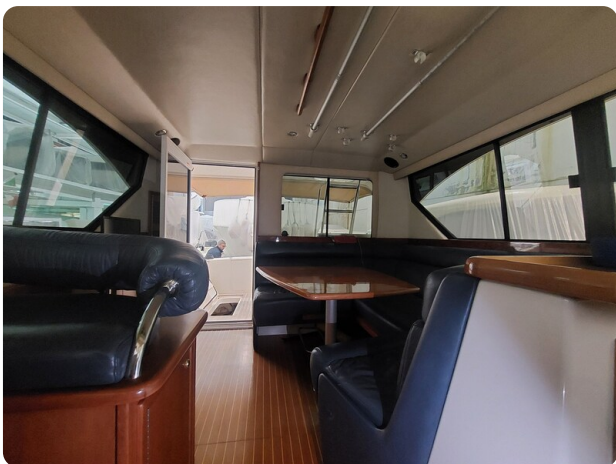
Riviera 33 fly 4