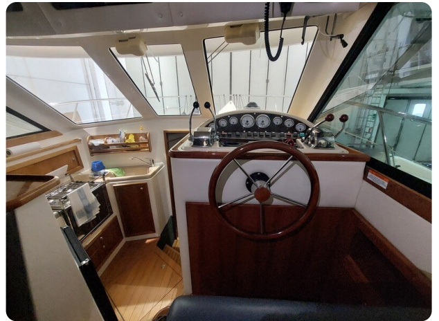
Riviera 33 fly 3