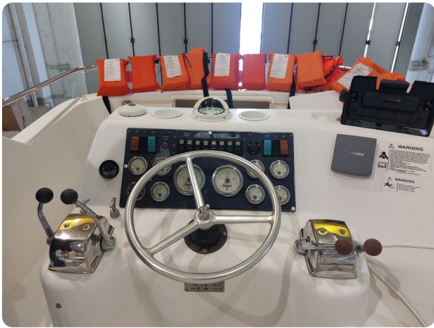
Riviera 33 fly 1